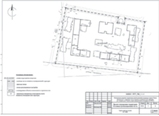
ПРИЛОЖЕНИЕ № 2 к проекту планировки территории жилой застройки городского округа «Город Архангельск» в границах части элемента планировочной структуры: ул. Гагарина, ул. Розинга, просп. Дзержинского, в границах которой предусматривается осуществление деятельности по комплексному развитию территории