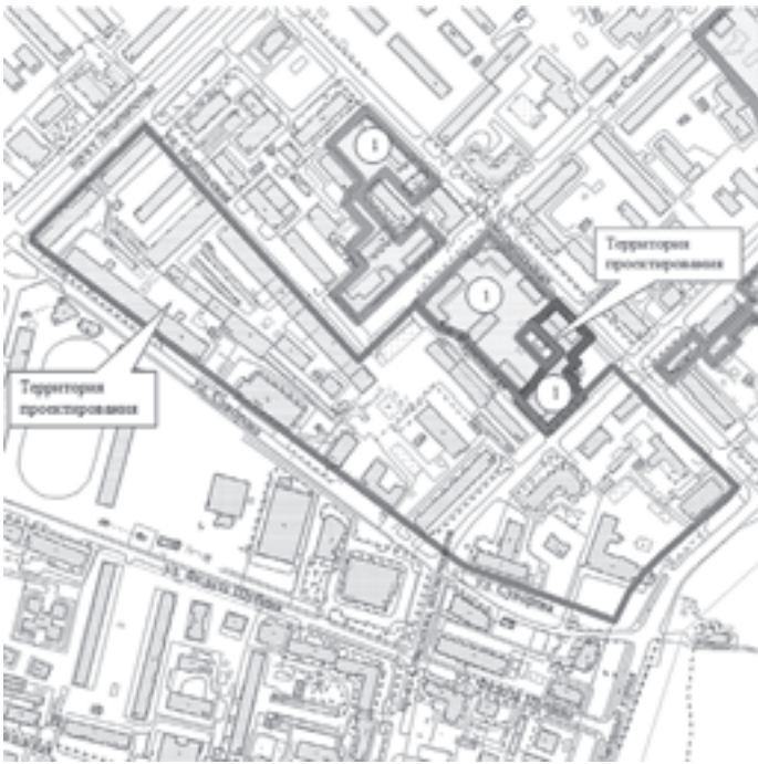
1 – Территория, в границах которой предусматривается осуществление деятельности по комплексному развитию территории

ПРИЛОЖЕНИЕ № 1 к заданию на подготовку проекта внесения изменений в проект планировки межмагистральной территории (жилой район Кузнециха) муниципального образования «Город Архангельск» и проекта межевания территории в границах элемента планировочной структуры: просп. Ломоносова, ул. Суворова, просп. Обводный канал, ул. Комсомольская, ул. Самойло, ул. Карельская площадью 10,3772 га