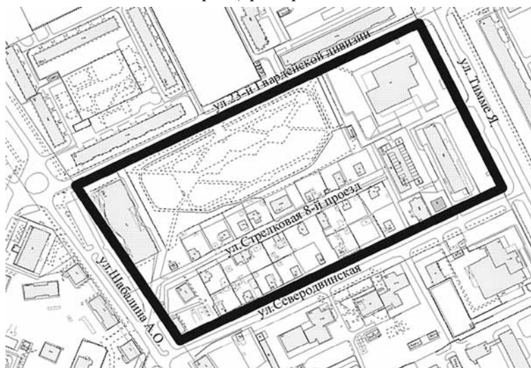
СХЕМА границ проектирования

ПРИЛОЖЕНИЕ к заданию на подготовку проекта межевания территории городского округа «Город Архангельск» в границах элемента планировочной структуры: ул. 23-й Гвардейской дивизии, ул. Тимме Я., ул. Северодвинская, ул. Шабалина А.О. площадью 7,3709 га