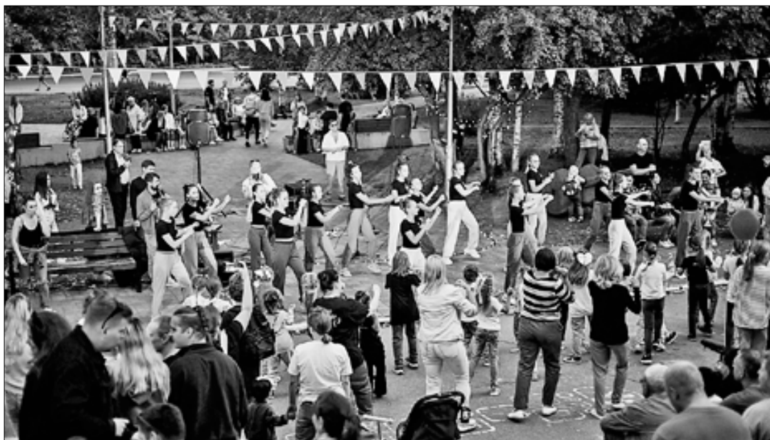
■ Музыкальный парк «Пять пятниц».

Кстати, администрацией Архангельска разработана программа обеспечения устойчивости городского бюджета: эффект от ее применения за три года превысил 1,3 миллиарда рублей.