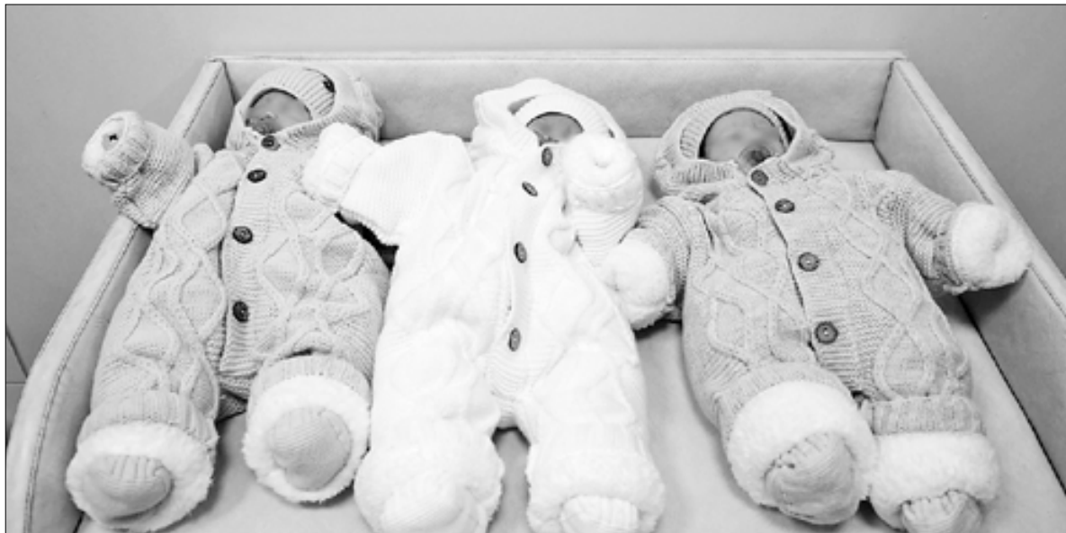
■ С момента открытия перинатального центра в его стенах появились на свет 11 тройняшек

– О каких именно возможностях оказания помощи идет речь?