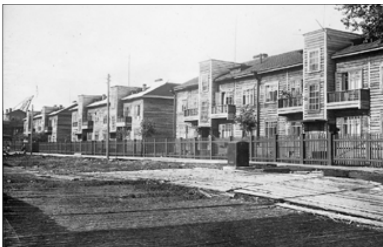
■ Дома сотрудников АЛТИ на улице Северодвинской, построенные в стиле конструктивизма в 1930-е годы силами студентов АЛТИ

вать людям, – делится Наталья Михайловна. – Это был удивительный, дружный квартал, объединявший интеллигенцию из раз-