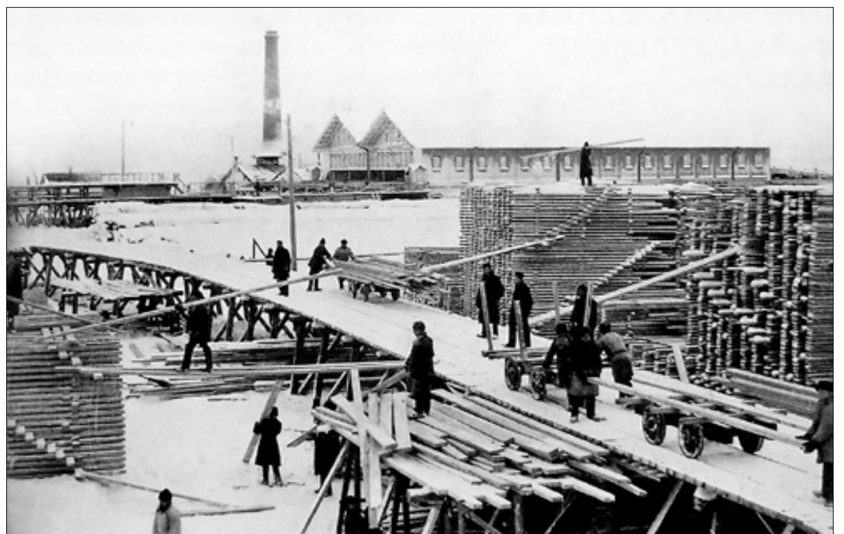
■ Лесозавод № 3 в советские годы

У меня сохранились свои детские воспоминания о третьем лесозаводе. В поселок