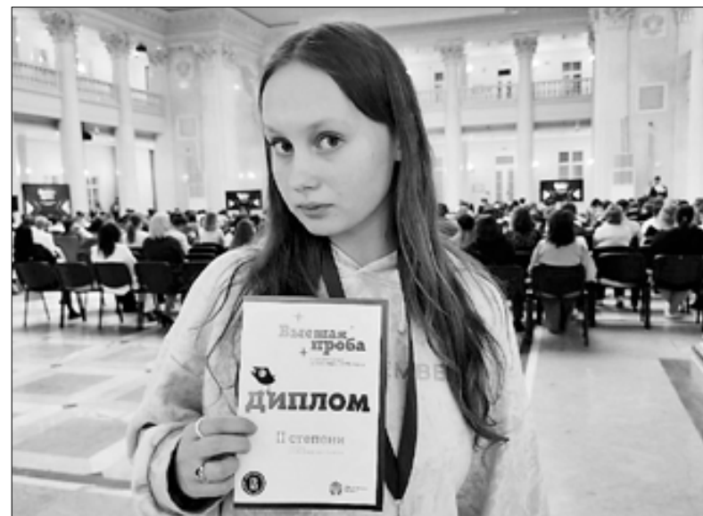
По материалам министерства образования Архангельской области

Победители и призеры олимпиады «Высшая проба» могут воспользоваться льготами: поступить в вуз без экзаменов или получить 100 баллов ЕГЭ по профильному предмету.