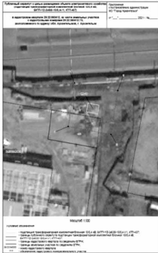
Сообщение о возможном установлении публичного сервитута в целях размещения объекта электросетевого хозяйства (Подстанция трансформаторной комплектной №588 в г. Архангельске)

Графическое описание местоположения границ публичных сервитутов с указанием координат характерных точек границ публичного сервитута: