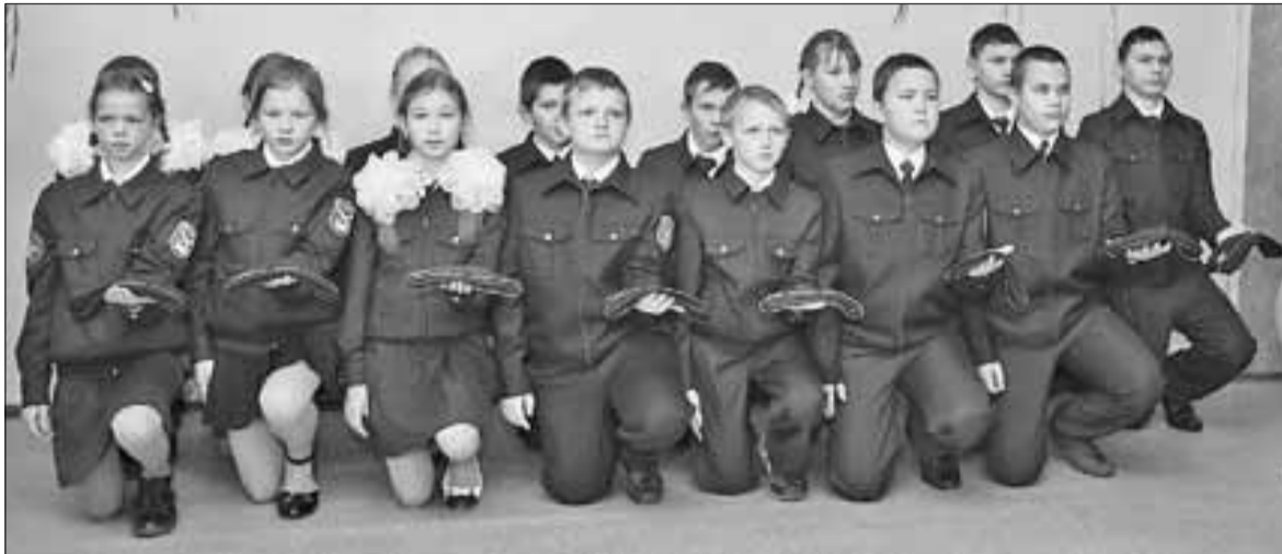
■ И теперь на защите страны стало больше на целый отряд!..

А.Ш.: – В 2011 году мы открыли первый кадетский класс и вдруг узнаем, что 518-му авиаполку – 70 лет, в Архангельске на юбилей приедут ветераны из разных уголков страны. Мы решили пригласить их на церемонию посвящения в кадеты. Была проделана большая подготовительная работа, в том числе по сбору материалов об истории полка в Великую Отечественную войну и в послевоенное время. Никогда не забуду тот день, когда ветераны прямо с самолета, с сумками, заходили в школу, как они обнимались со своими товарищами, с которыми не виделись долгие годы. Мы подготовили фотовыставку об офицерах полка. И они, рассматривая снимки, находили себя, еще молодых. Все это происходило на глазах у детей, было трогательно до слез. Погоны кадетам вручали ве-