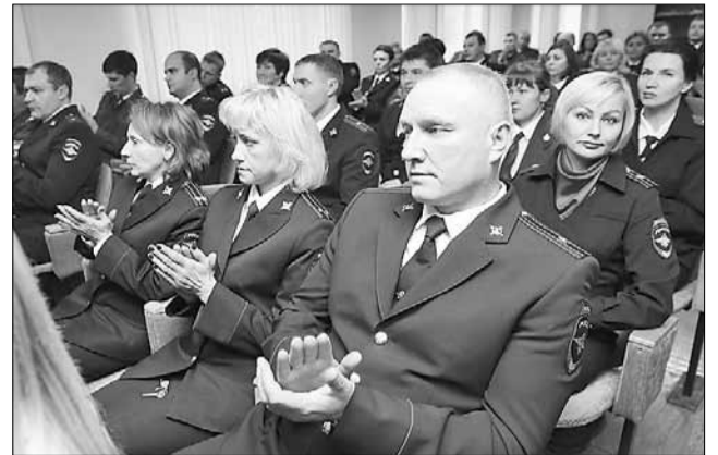
Торжественно отметили День работников органов внутренних дел в Архангельском городском управлении МВД.