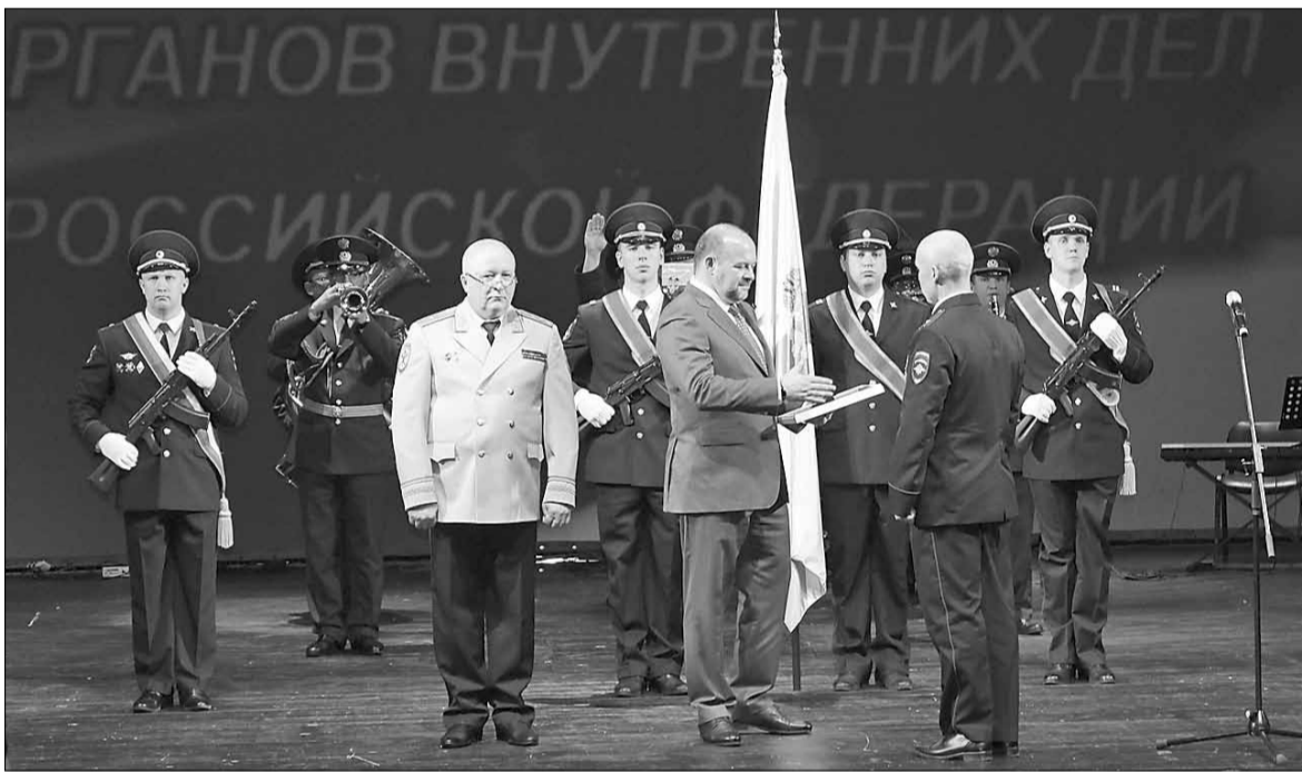
Праздничное мероприятие в театре драмы.

– Это праздник тех, кто, не щадя себя, каждый день противостоит преступности, кто обеспечивает безопасность на улицах области, кто первый приходит на помощь попавшим в беду. Труд сотрудников органов внутренних дел – круглосуточный, и в свой профессиональный праздник многие из них находятся на боевом посту. Вы ведете бескомпромиссную войну с преступностью, и в историю навечно вписаны имена сотрудников, погибших при исполнении