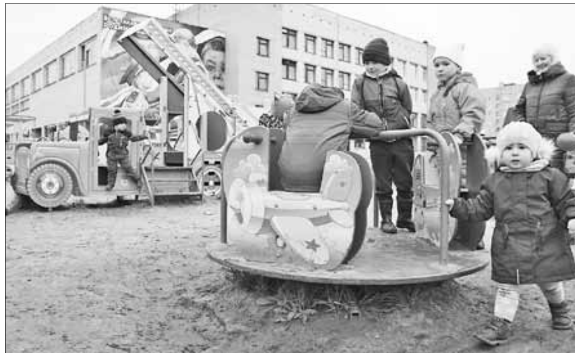
Наталья ЗАХАРОВА

Дискуссия: Не боятся ли солombальцы приводить своих чад на детскую площадку «Силевичок», нашумевшую в соцсетях