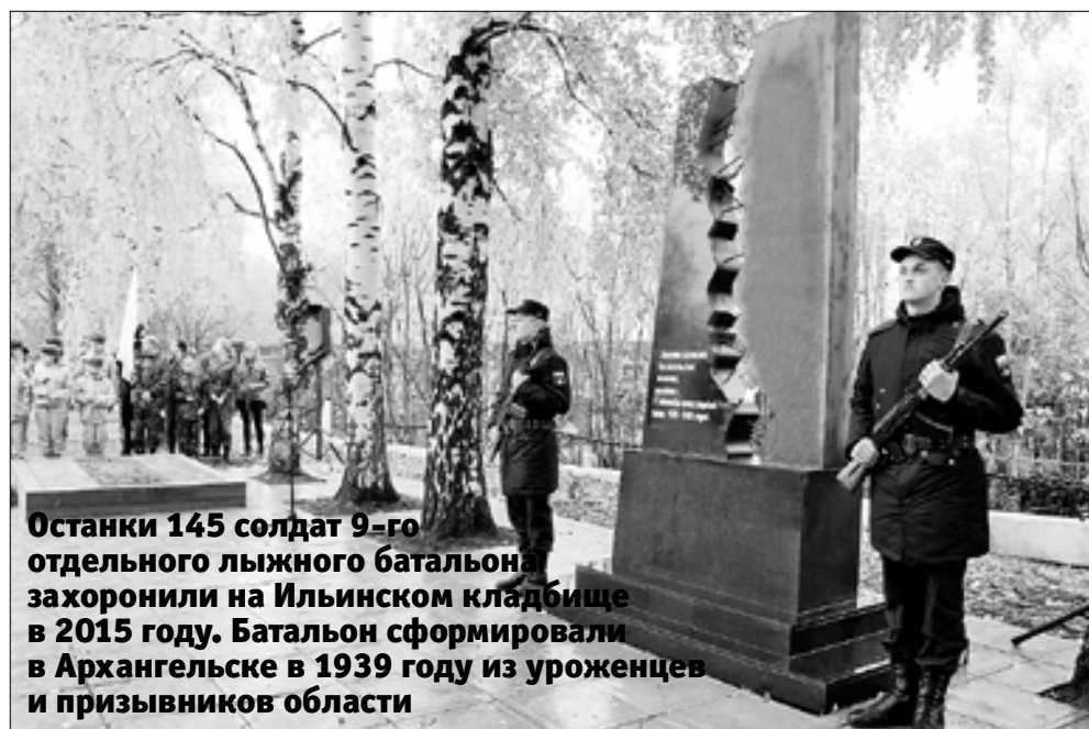
Останки 145 солдат 9-го отдельного лыжного батальона захоронили на Ильинском кладбище в 2015 году. Батальон сформировали в Архангельске в 1939 году из уроженцев и призывников области

– Мой отец был призван на фронт в ноябре 1939 года, погиб спустя два месяца. Нет ни одного дня, чтобы я о нем не вспоминала. Это был необыкновенной доброты человек. С открытием этого памятника для меня появилось место, где я смогу поклониться всем бойцам той страшной войны.