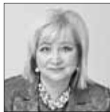
Елена ВТОРЫГИНА Депутат Государственной Думы – об определении оптимальной модели МСУ

«Война санкций рано или поздно закончится, а базу – отношения между Ригой и регионами России, культурные, экономические, спортивные связи – нужно сохранять. Чтобы не надо было потом начинать с пустого места»