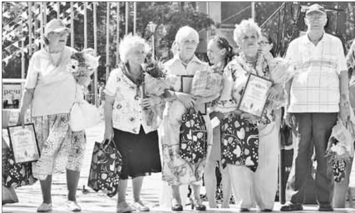
■ Вручать ветеранам-активистам городскую премию «Доброта. Доверие. Достоинство» в Архангельске стало доброй традицией

Надо отметить, что большое внимание уделяется и работе клубов для ветеранов, организации досу-