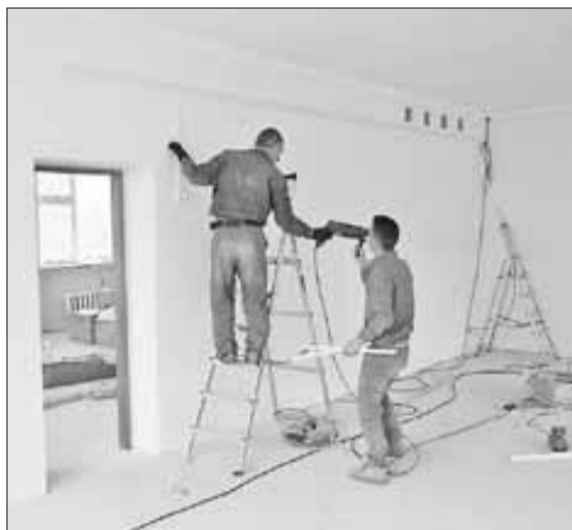
■ В здании детсада завершается чистовая отделка

Специалисты инспекции осмотрели помещения дет-