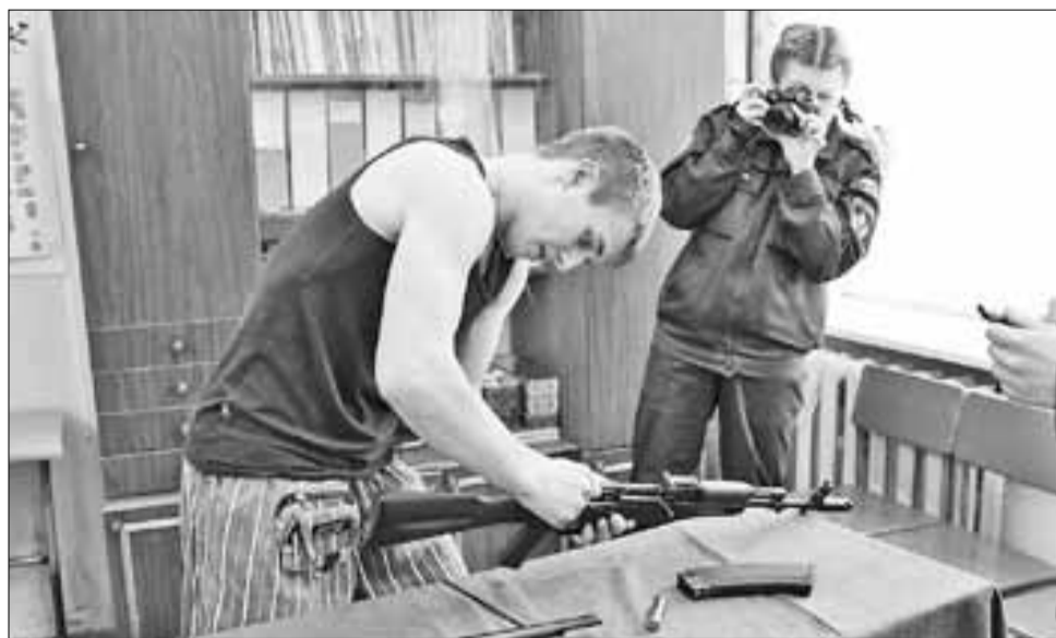
■ Многие архангельские мальчишки к военной службе готовятся заранее

Служба: С 1 октября начался осенний призыв архангелогородцев, достигших призывного возраста