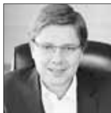
Нил УШАКОВ Мэр Риги – об экономических отношениях Латвии и России

«Война санкций рано или поздно закончится, а базу – отношения между Ригой и регионами России, культурные, экономические, спортивные связи – нужно сохранять. Чтобы не надо было потом начинать с пустого места»