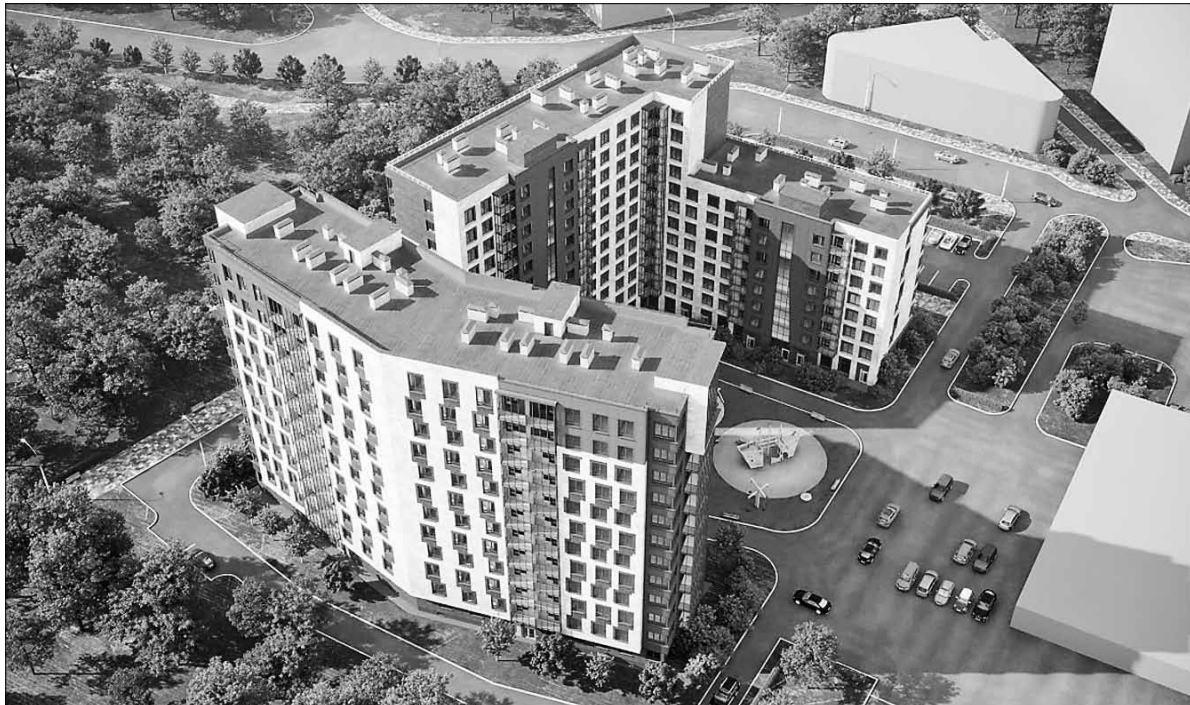
■ Проект по строительству жилого комплекса на улице Нагорной

По итогам реализации этого проекта, общий объем инвестиций составит 2,35 миллиарда рублей. В собственность региона будет передано не менее 3,3 тысячи квадратных метров жилья. Это примерно 102 квартиры стоимостью свыше 362 миллионов рублей. Строительство на этом участке планируется завершить в 2027 году.