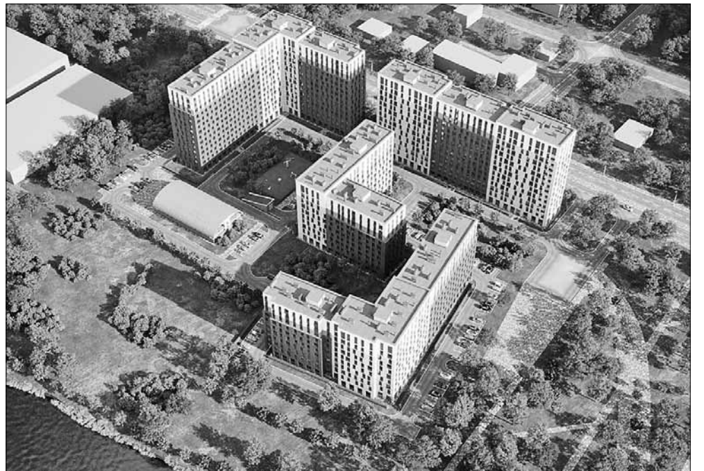
■ Проект разновысотного жилого комплекса на Ленинградском проспекте между территорией водоочистой станции и сквером