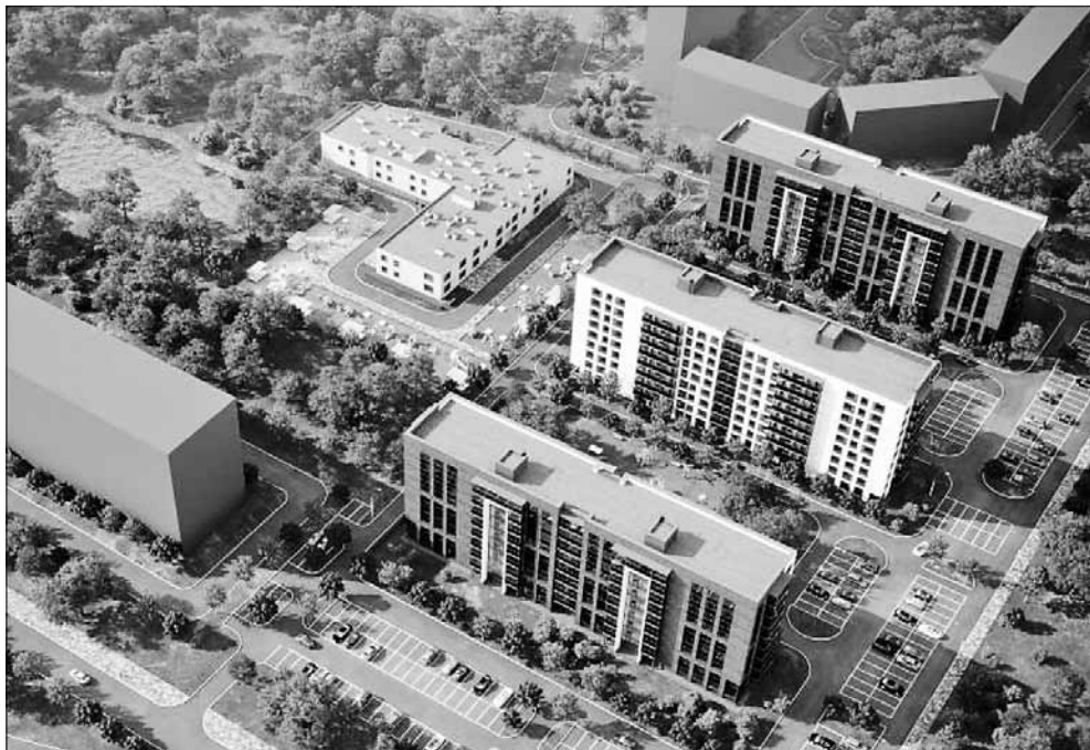
■ Проект строительства в Северодвинске на проспекте Победы, в районе его пересечения с проспектом Труда

Электронная почта: invest@akvilon-invest.ru