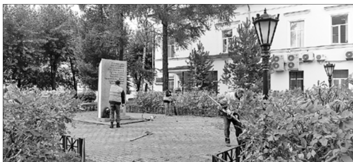
В Октябрьском округе Архангельска дворники убирают территорию возле памятника Ломоносову. Здесь были подстрижены кусты, почищены дорожки, проведена уборка мусора. Также рабочие заменяют брусчатку и красят заборы

В Исакогорском и Цигломенском округах на данный момент набраны все шесть рабочих по благоустройству. Ежедневно они занимаются ручным подбором мусора: сегодня трудятся на ул. Адмирала Макарова, на проезде вдоль железной дороги от ул. Дрейера