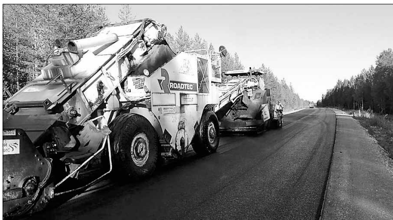
■ Новый асфальт автодороги Архангельск – Белогорский – Пинега – Кимжа – Мезень в Холмогорском районе.