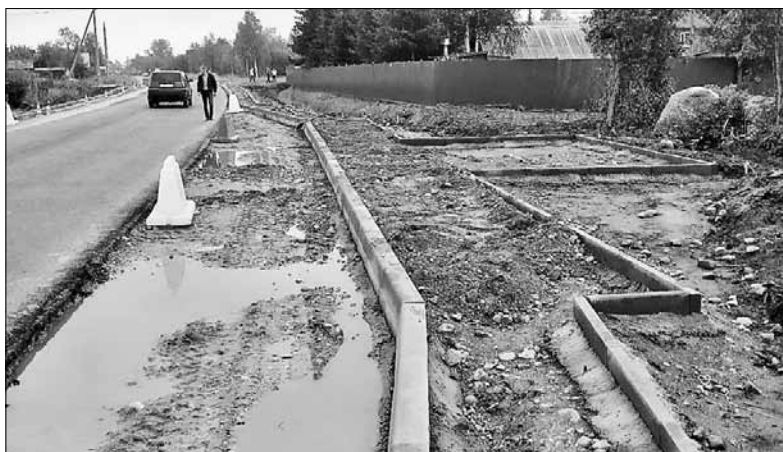
■ Ход работ на направлении Архангельск – Пинега.