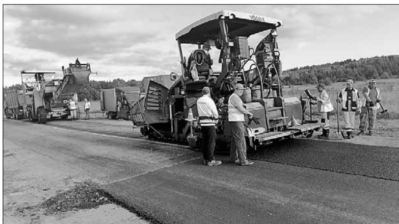
■ Завершены работы по укладке верхнего слоя асфальтобетона на участке автодороги Архангельск – Белогорский – Пинега – Кимжа – Мезень. ФОТО: ПРЕСС-СЛУЖБА «АРХАНГЕЛЬСКВАТТОДОРА»

ФОТО: ПРЕСС-СЛУЖБА «АРХАНГЕЛЬСКВАТТОДОРА»