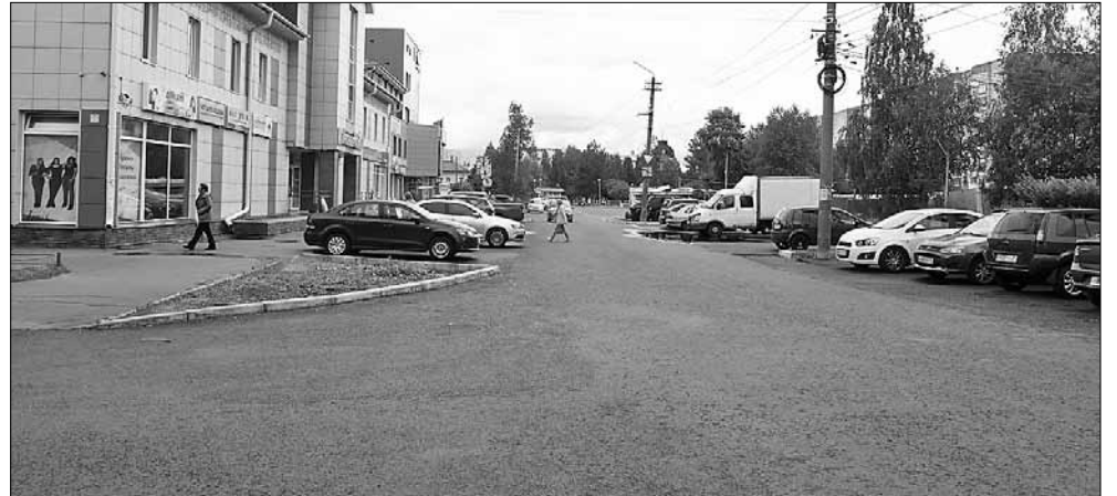
■ Улица Беломорской Флотилии