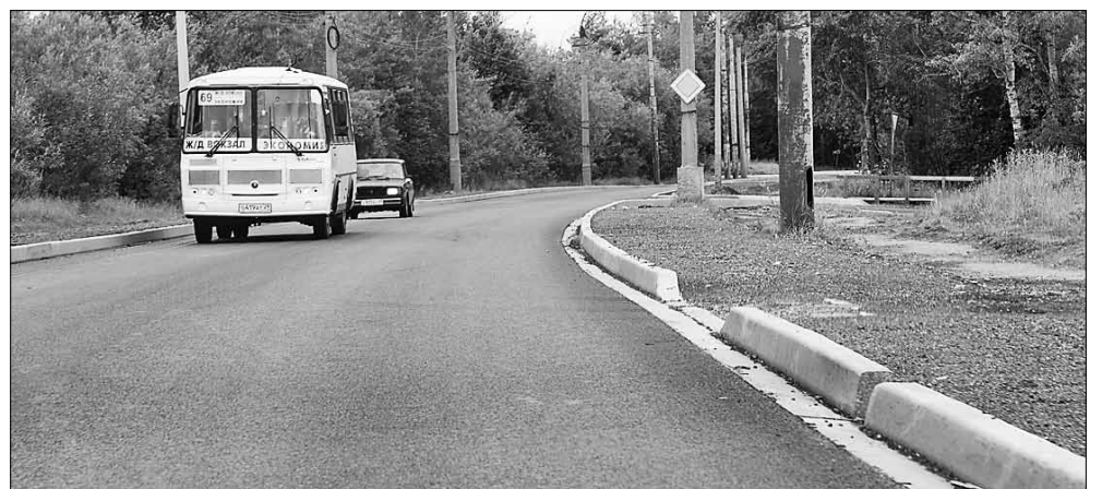
■ Улица Победы