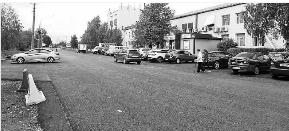
■ Улица Мещерского

мы знаем, бетон набирает прочность в течение 28 дней. И как только монолит наберет необходимую прочность, защита будет демонтирована и движение по мосту вернется к прежним темпам.