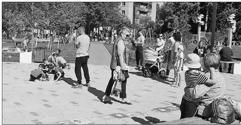
■ В сквере имени Грачева в выходные многолюдно