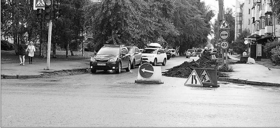
■ Улица Гайдара