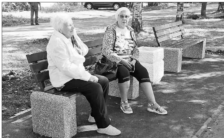
■ Новые скамейки вдоль Ленинградского оценили жители округа