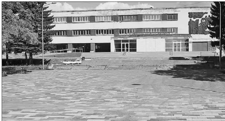
■ Преображается площадь перед Ломоносовским ДК

рена, что спортивная площадка будет востребована не только молодежью – с удовольствием на уличных тренажерах будут заниматься и люди старшего возраста.