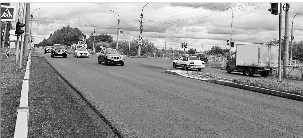
■ Маймаксанское шоссе

Горожане получили возможность детально узнать, какие участки дорог готовятся к реконструкции, какой будет ширина проездов, как будут обустроиваться заезды и прочее