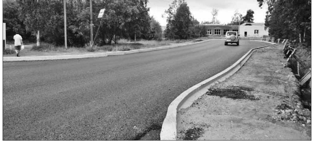
■ Улица Магистральная

сурсоснабжающих организаций и разработали график ремонта автомобильных дорог, которые мы планируем проводить, в том числе и в рамках национального проекта. На основании этого графика ресурсоснабжающие организации уже начали планировать свой ремонт.