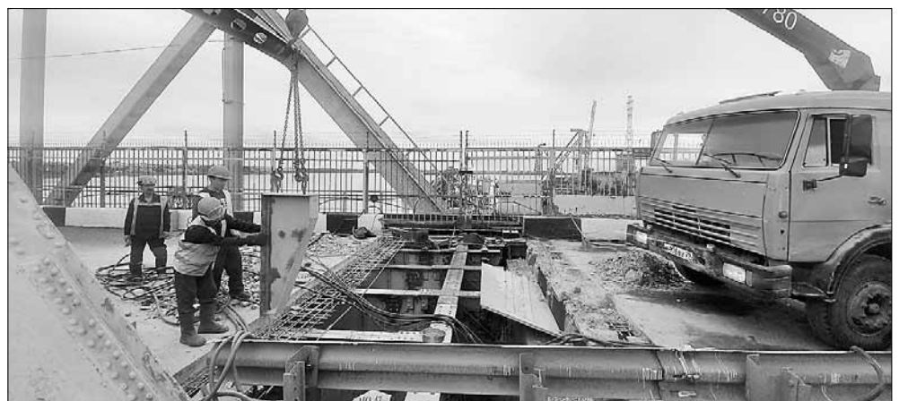
■ Ремонт железнодорожного моста