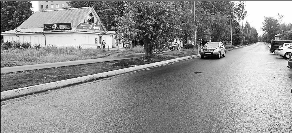
■ Улица Русанова