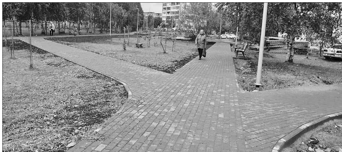
■ Благоустройство сквера на ул. 23-й Гвардейской Дивизии.

Кроме того, за счет дополнительных средств из областного бюджета в размере 174,5 миллиона рублей к благоустройству в этом году запланированы парк им. В. И. Ленина, сквер на площади Терехина, площадь Мира, набережная Северной Двины, пространство вдоль проспекта Чумбарова-Лучинского и общественная территория в районе домов №№ 8, 10 и 12 по улице Воскресенской. Часть средств напра-