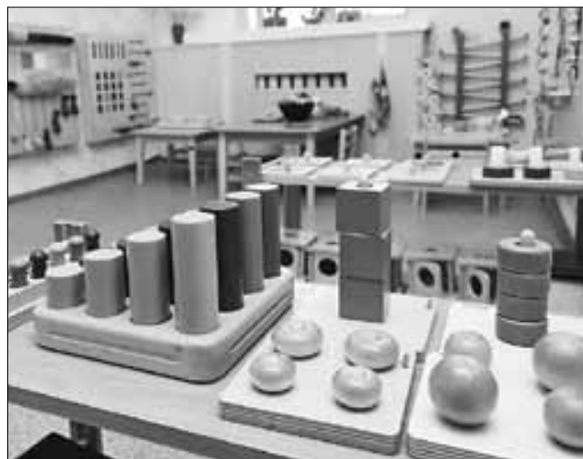
■ Здесь малышей учат различать форму и цвет предметов