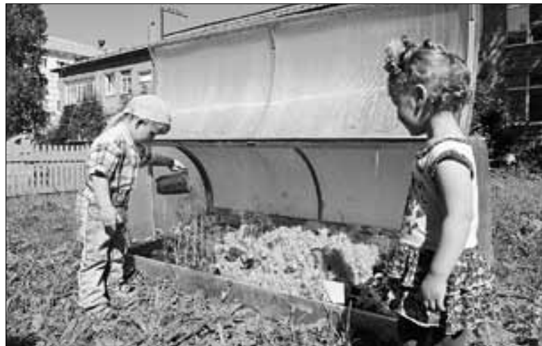
■ Проект «Огород»: дети сами выращивают овощи и собирают урожай