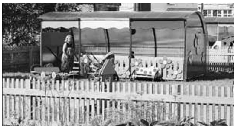
■ Хорошие условия созданы и для прогулок детей