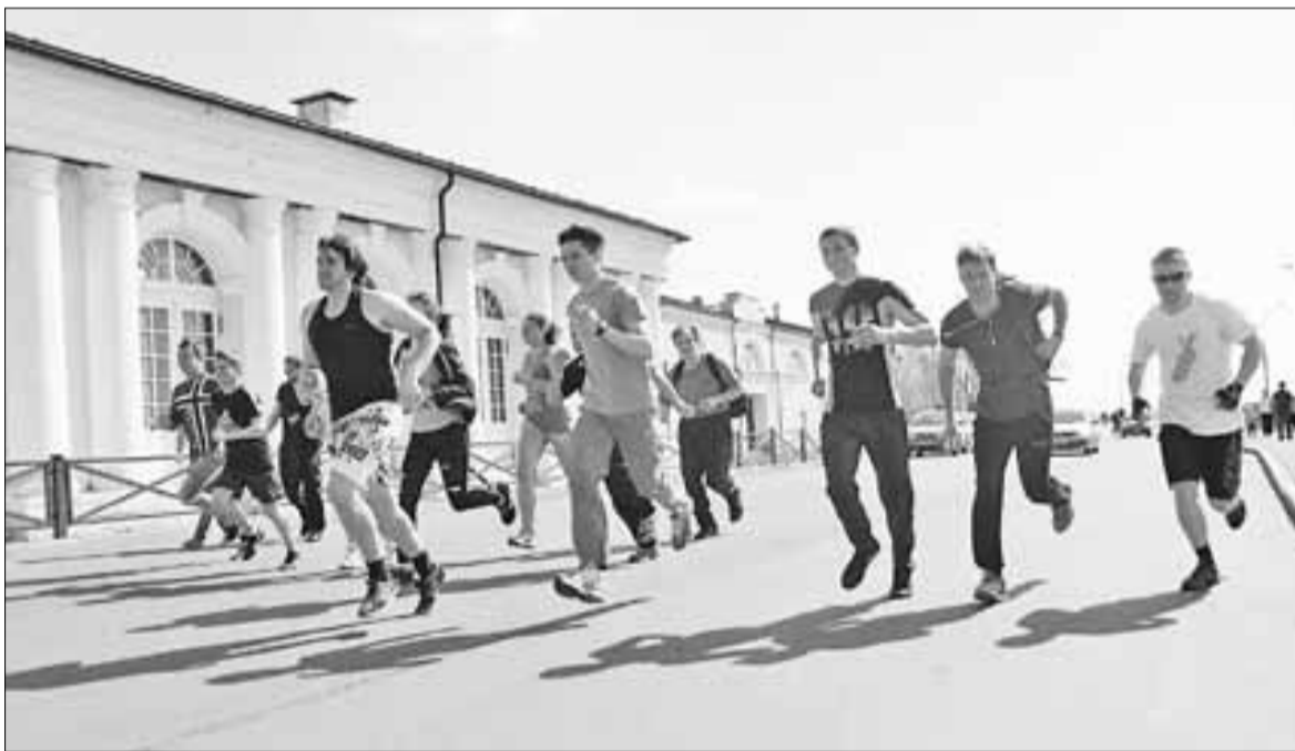
■ Сейчас ребята развивают интересный проект «Догоняй».

Одно из приоритетных направлений архангельского движения – контроль за соблюдением правил торговли алкогольной и табачной