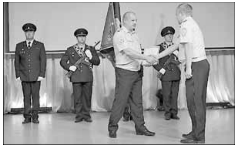
■ На торжественном мероприятии лучшие сотрудники службы получили награды и благодарности.

На торжественном мероприятии лучшие сотрудники службы получили награды и благодарности.