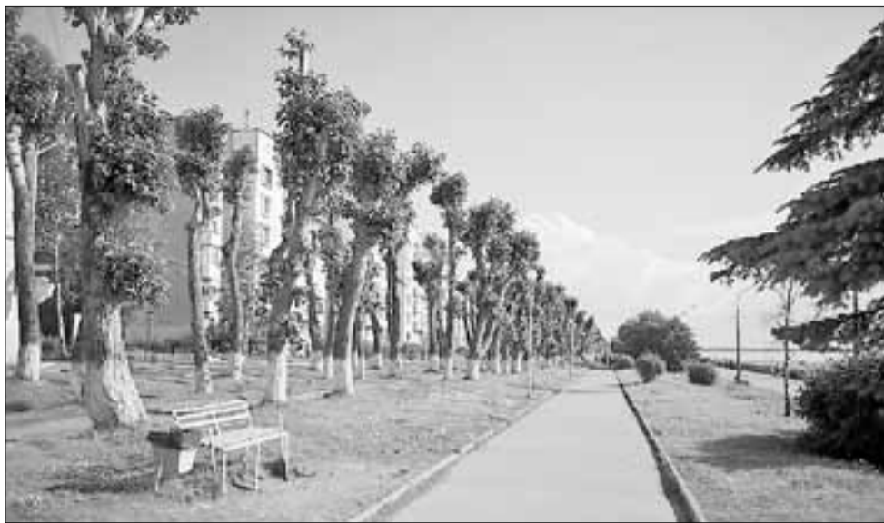
■ Если тополя своевременно «подстригать», пуха от них будет меньше

Актуально «тополиная» проблема и в столице. В рамках проекта «Активный гражданин» москвичам было предложено проголосовать, какие зеленые насаждения они хотели бы видеть. Больше всего голосов получил каштан, также популярны береза, ель, чере-