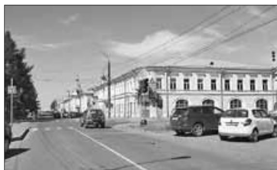
■ 2016 год