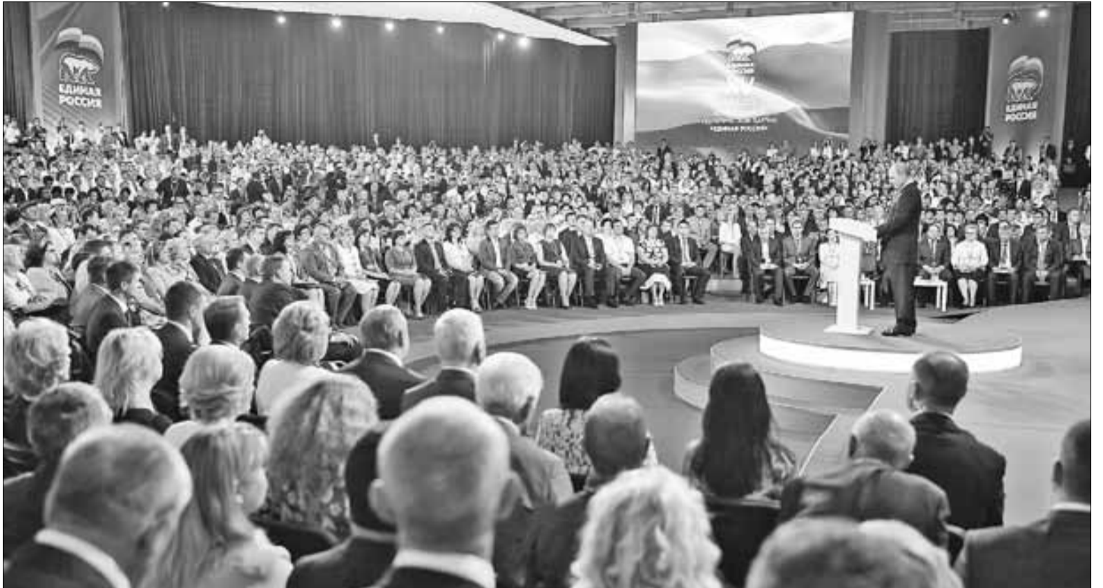
■ На съезде присутствовало более двух тысяч делегатов.

Делегаты рассмотрели два ключевых вопроса – программу партии и утверждение кандидатов на думские выборы 18 сентября этого года. Накануне съезда работали десять дискуссионных площадок, на которых обсуждались основные положения партийной программы на ближайшие пять лет – по