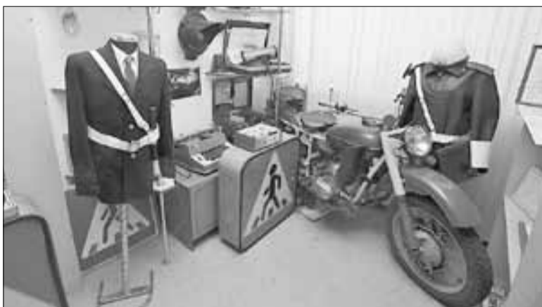
■ Мотоцикл и мундир – часть истории

Светофор старого образца имеет не очень яркие линзы и обычную электрическую лампочку внутри, в то время как в современных устройствах уже используются светодиодные лампы. Интересен как экспонат и сохранившийся пешеходный светофор.