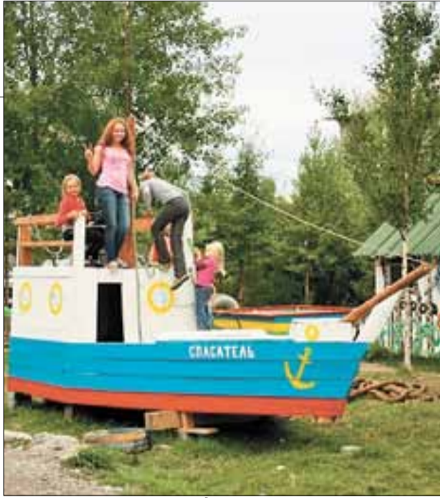
■ Пр. Ленинградский, 381/4.