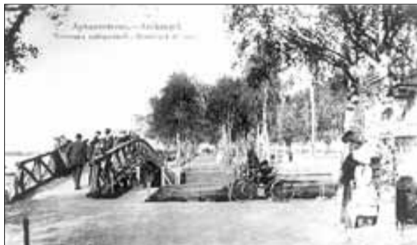
■ Пересечение набережной и улицы Попова в начале XX века и в 2016 году

Продолжаем сравнивать Архангельск в начале XX века, в 1984 году и сегодня