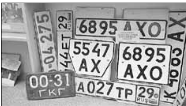
■ Старые номера часто подделывали