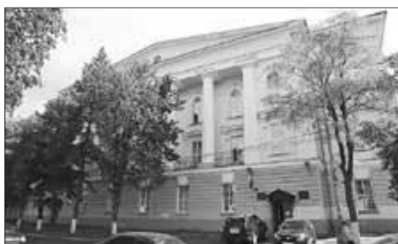
■ 2016 год