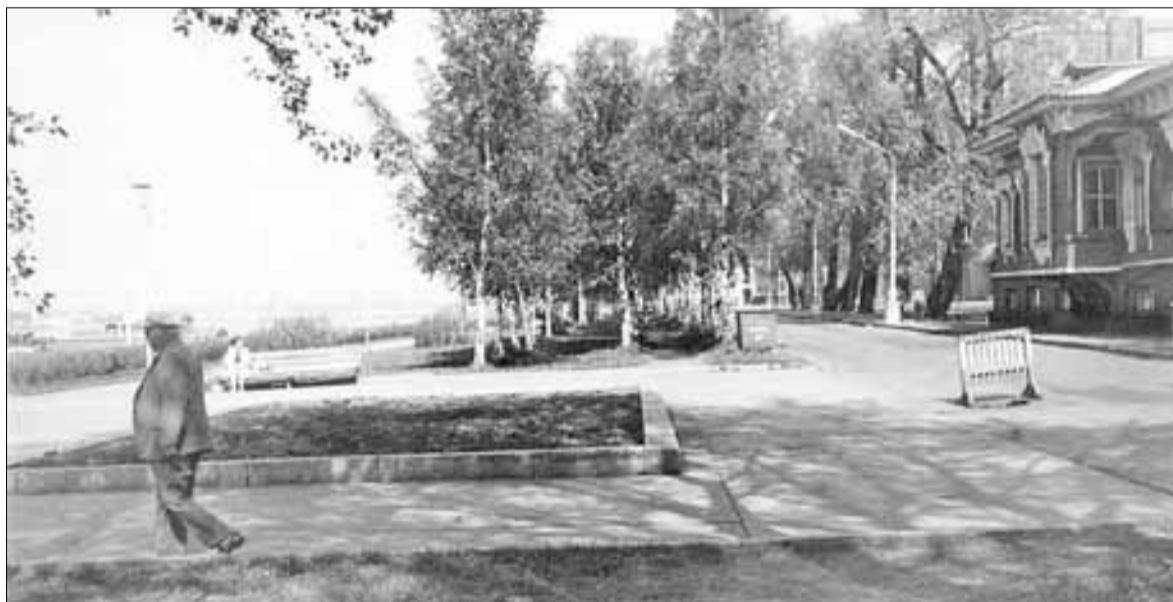
■ Так набережная и особняк Суркова выглядели в 1984 году

Идем на В фотоальбоме семьи Поповых более 20 пар снимков, так что в следующем номере мы продолжим эту тему.