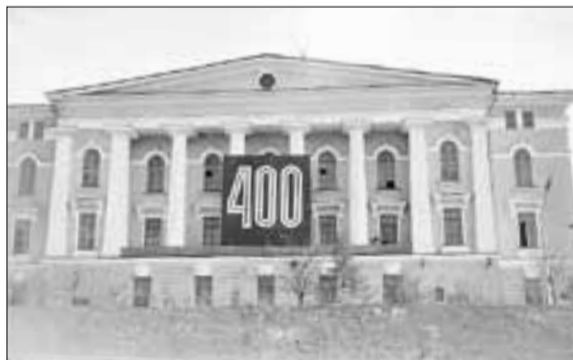
■ 1984 год