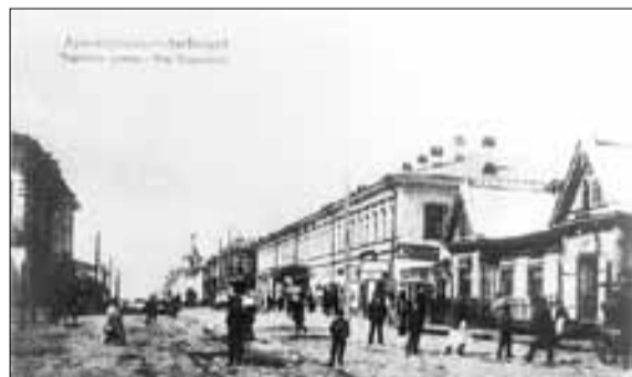
■ Начало XX века