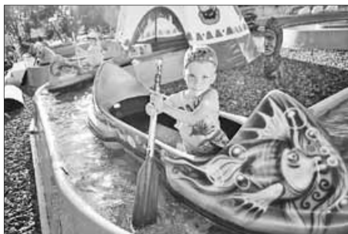
■ Водный аттракцион «Индийская река»

открытием проводится тестирование. Как и любое оборудование, они проходят обязательный техосмотр – еженедельный, ежемесячный, квартальный. Раз в год состояние аттракционов оценивает сторонняя независимая организация и дает свое заключение.