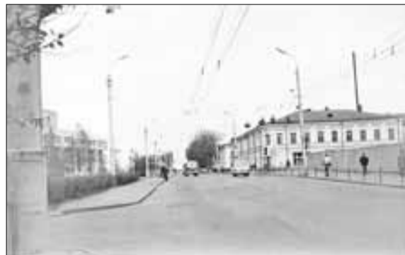
■ 1984 год