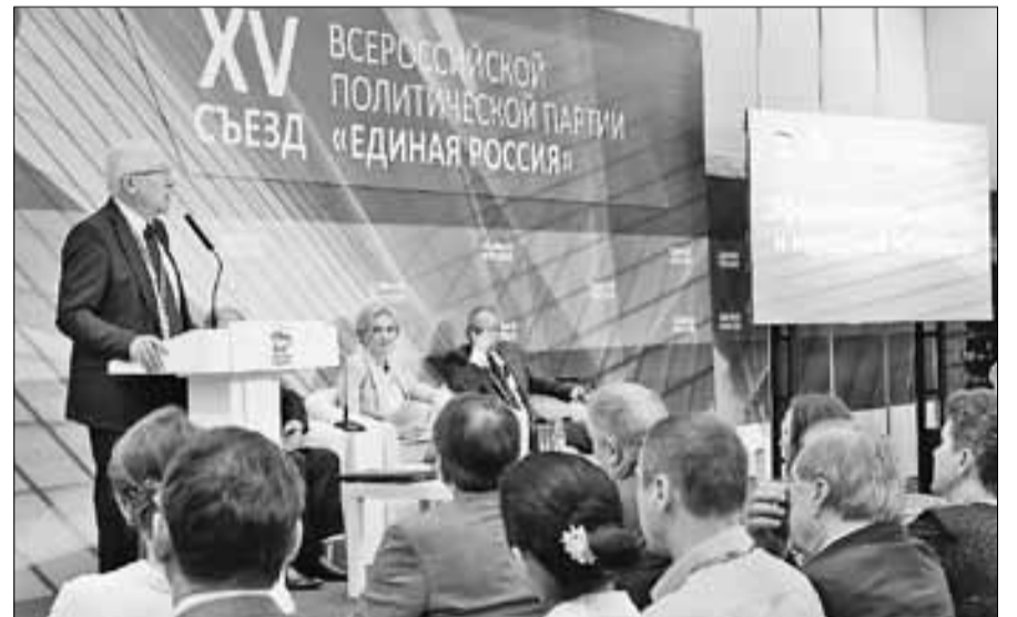
■ Член Совета Федерации Олег Морозов и депутат Госдумы Ирина Яровая на дискуссионной площадке по обсуждению эффективности власти