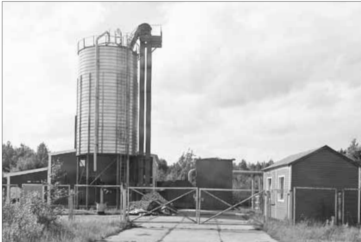
■ Современные котельные на пеллетах работают на окраинах города.

Помимо использования в населенных пунктах, есть еще один отличный вариант применения плавучих АС. У нас в стране очень много месторождений, которые мы не можем разрабатывать по од-