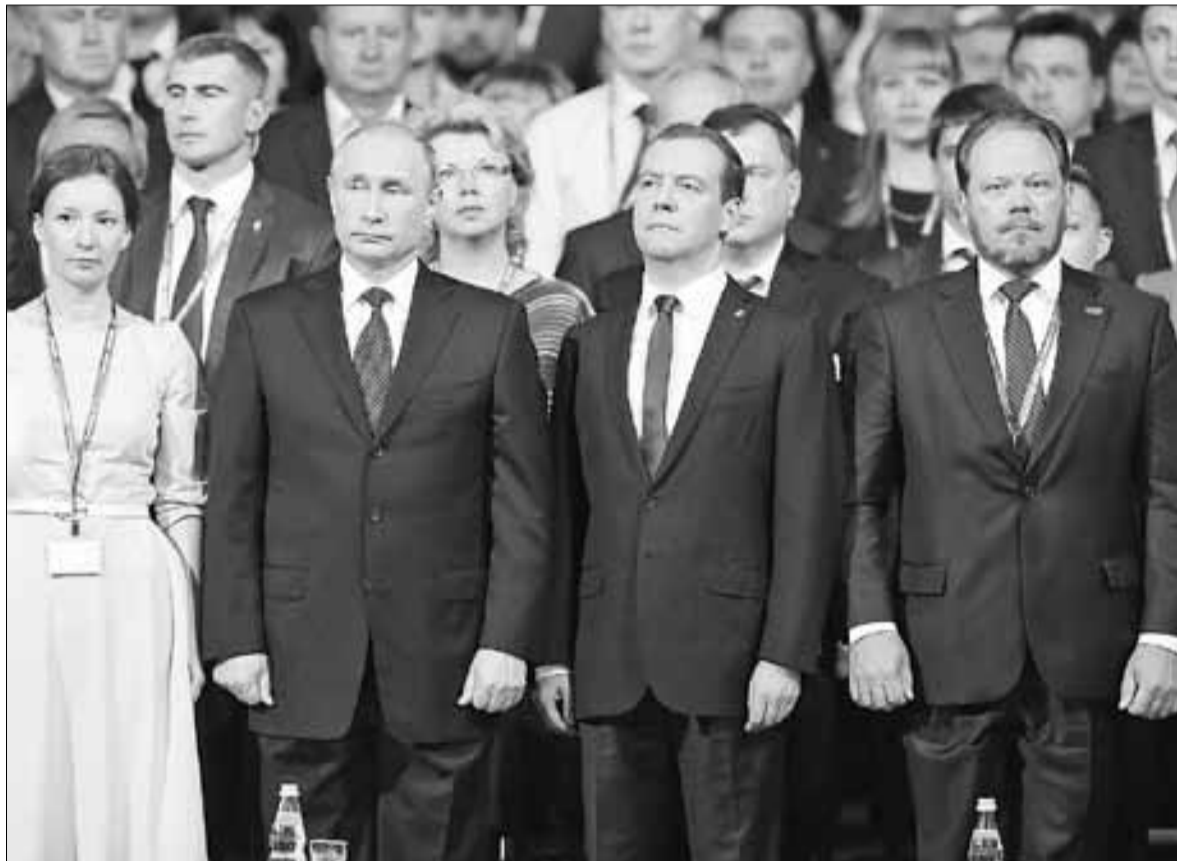
■ Звучит гимн Российской Федерации.

XV предвыборного съезда партии «Единая Россия»