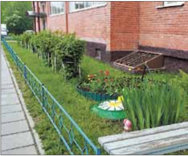
■ Ул. Галушина, 12. ФОТО: АРХИВ РЕДАКЦИИ