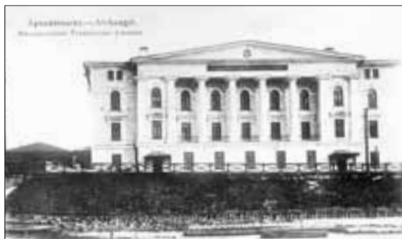
■ Начало XX века