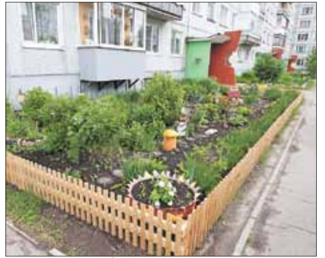
■ Ул. Советская, 17/2.