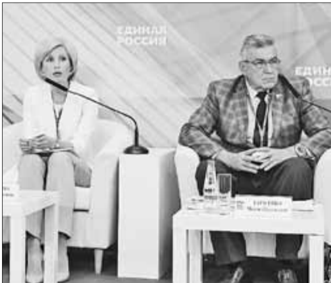
■ Модераторы площадки «Социальная политика» – депутаты Госдумы Ольга Баталина и Михаил Тарасенко

– Нашим важнейшим принципом является выполнение социальных обязательств, – сказала председатель комитета Ольга Баталина. – Россия – социальное государство, что закреплено в Кон-