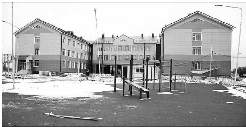
■ Подобная школа уже построена в Архангельске и вскоре примет детей огромного и бурно развивающегося района

– В рамках концессионного соглашения планируется возвести общеобразовательную школу на 860 мест в округе Майская Горка Архангельска – в районе улицы Ленина, – сообщил министр образова-