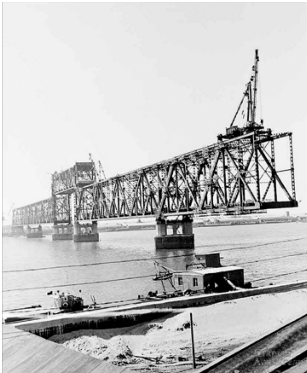
■ Строительство моста, 1964 год.