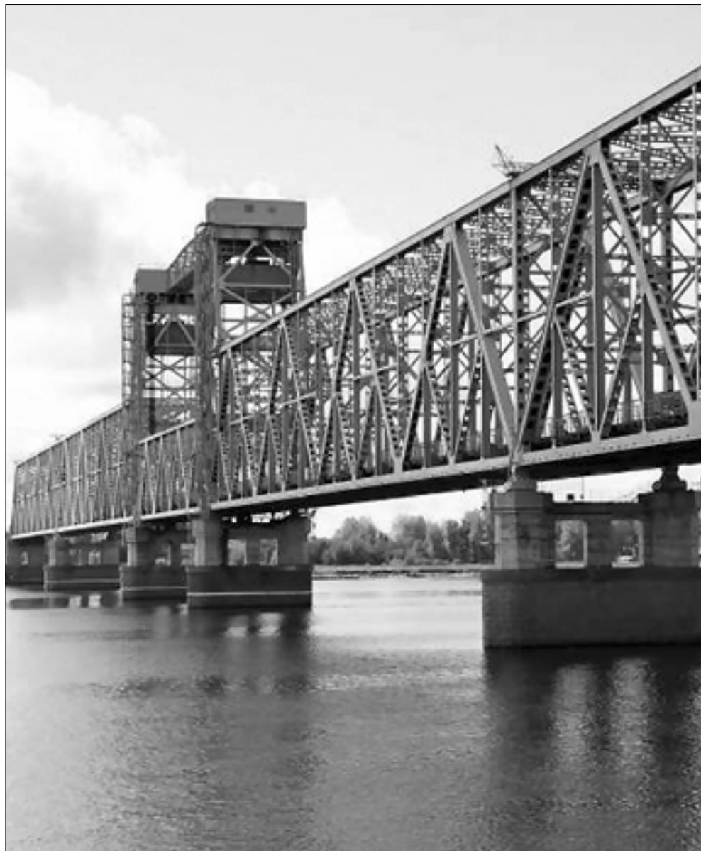
■ Железнодорожный мост сегодня.