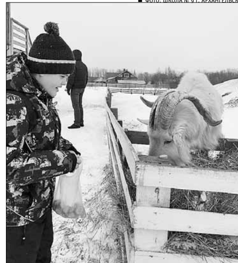
■ ФОТО: ШКОЛА № 9 Г. АРХАНГЕЛЬСК