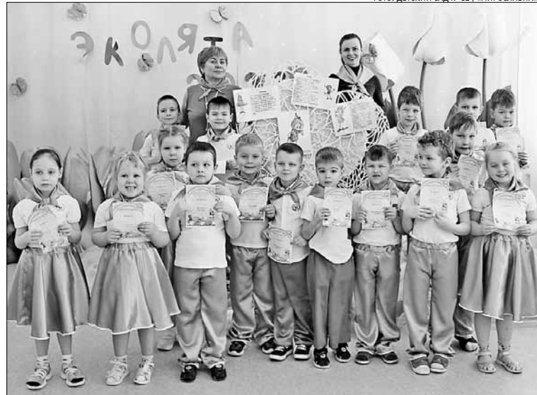
■ ФОТО: ДЕТСКИЙ САД № 124 «МИРОСЛАВНА»