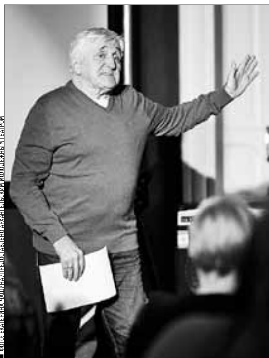
ФОТО: ЕКАТЕРИНА ЧАИЦКА/ПРЕДСТАВЛЕНИЕ АРХАНГЕЛЬСКИМ МОЛОДЕЖНЫМ ТЕАТРОМ

День театра в «Молодежном» отметили поэзией и музыкой