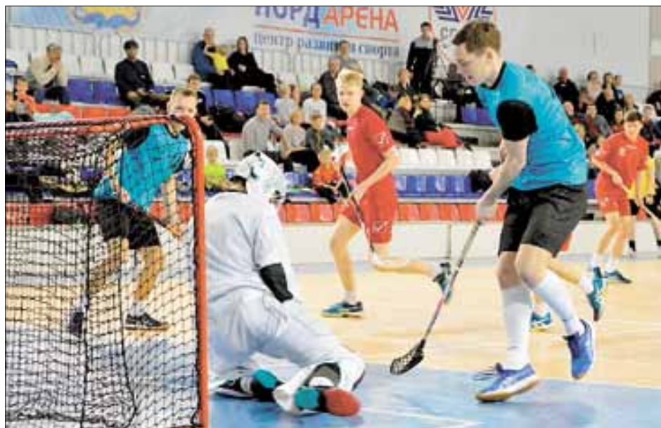
■ В атаке «Помор».