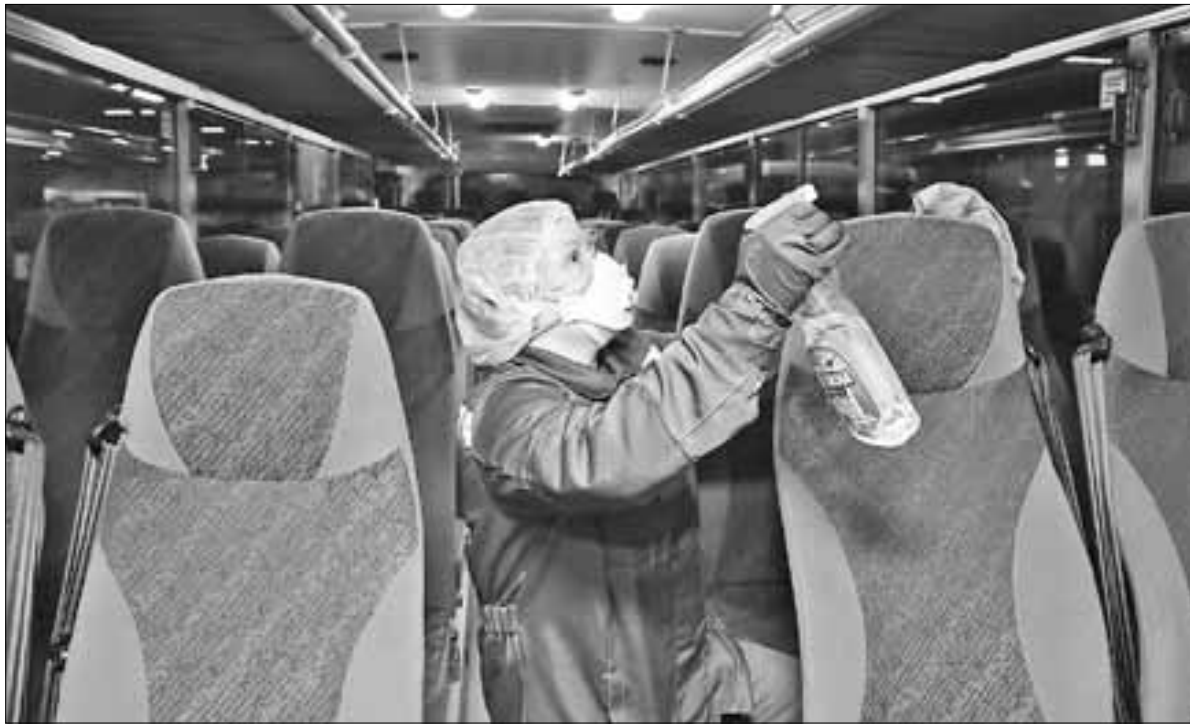
■ Салоны автобусов обрабатывают несколько раз в день

Ситуация с коронавирусом внесла коррективы и в движение общественного транспорта. На текущей неделе, которая объявлена нерабочей, автобусы будут ходить по режиму, утвержденному администрацией Архангельска. Многие горожане эту новость восприняли в штыки, однако мера обоснованная – пускать по улицам полупустые автобусы нело-