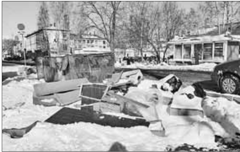
■ Удручающая картина на Новгородском, 41