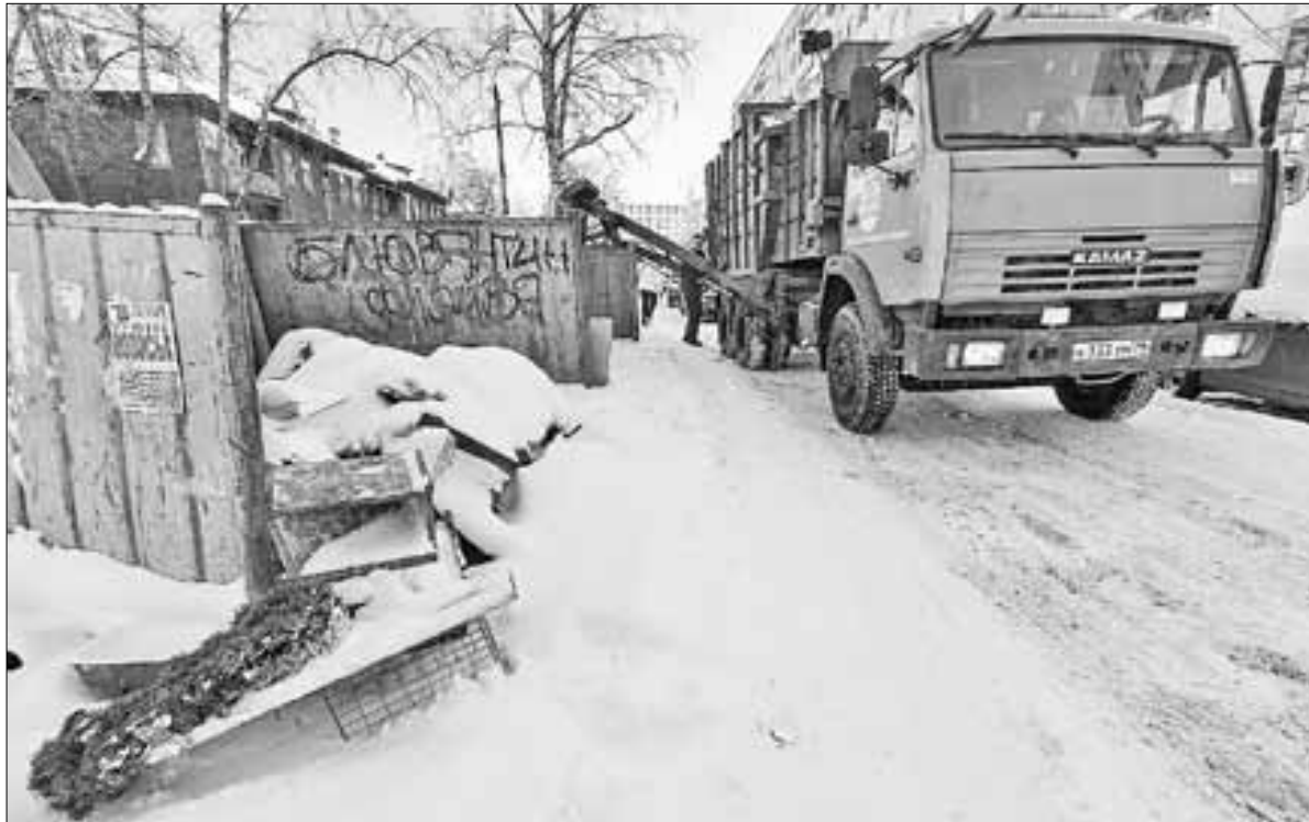
■ Вывоз мусора с площадки на пр. Советских Космонавтов, 37

– Вывоз организован строго в соответствии с требованиями действующих СанПин, то есть в теплое время года (средняя температура выше +5) – один раз в сутки, в холодный сезон – один раз в 72 часа. Санитарные требования допускают невывоз по техническим причинам в течение 72-х часов, но такой случай допускается не чаще чем раз в месяц. Указанные площадки вывозят регулярно – один раз в сутки. Их обслуживает транспортная компания – «Спецавтохозяйство по уборке города» (САХ). Крупногабаритные отходы вывозят реже, но тоже по графику: как правило, один-два раза в неделю. В частности, с площадки на Советских Космонавтов, 37 вы-