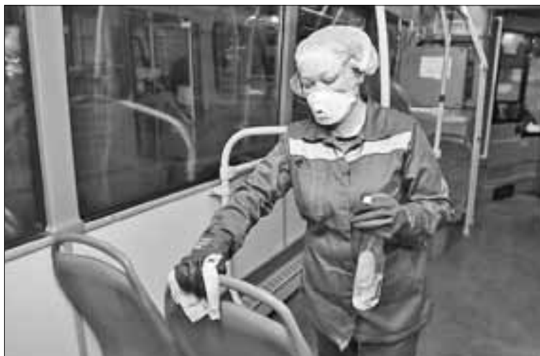
■ Дезинфицируют поручни, сиденья, стены – все, к чему прикасается пассажир

гично, уже к минувшей пятнице количество пассажиров уменьшилось на 35 процентов, и понятно, что это не предел.