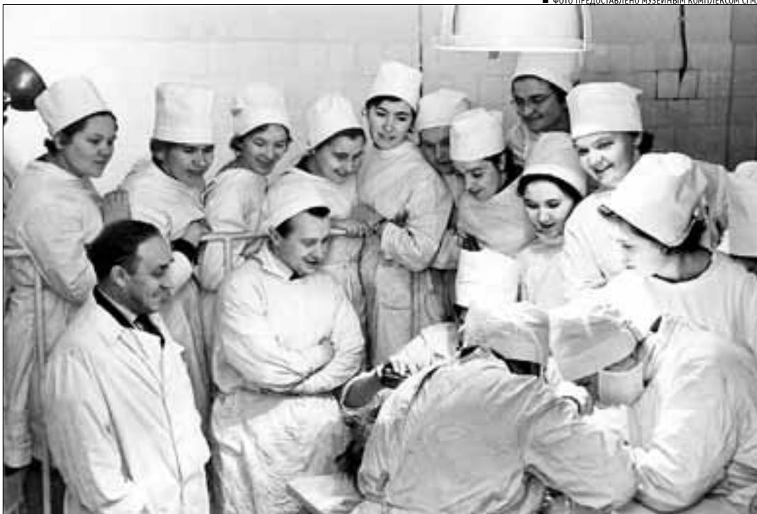
■ На занятии со студентами в операционной. 1980-е