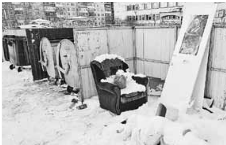
■ Крупногабарит ожидает своего часа на Советской, 17

валяется вокруг. Рядом – крупногабарит: никому не нужное кресло и парочка дверей. К сведению горожан, крупногабаритными считаются отходы, размеры которых превышают полметра в высоту, ширину и длину. И регоператор обязан вывезти их по установленному графику 1-2 раза в неделю.