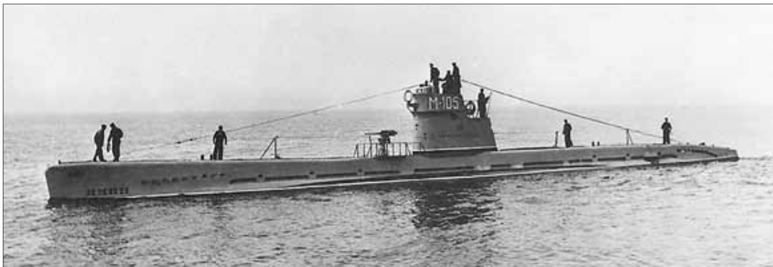
■ Подводная лодка М-105 Северного флота возвращается из боевого похода