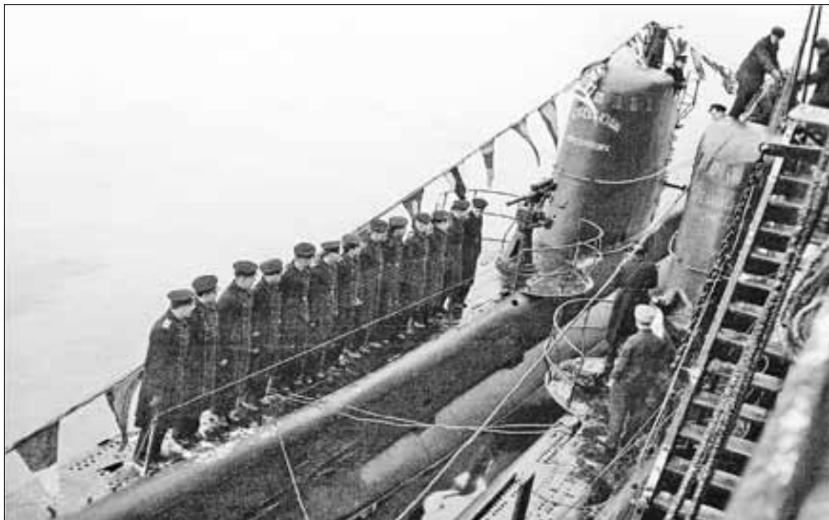
■ Торжественная церемония вступления в строй подводной лодки «Челябинскийсомолец». Полярное. 20 февраля 1943 года