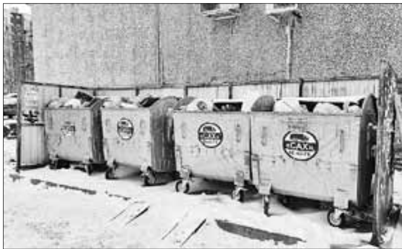
■ Контейнерная площадка на Садовой, 56