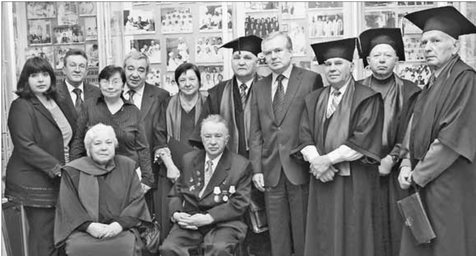
■ Члены совета старейшин и руководства СГМУ на открытии музея истории медицины Европейского Севера. 2009 г.