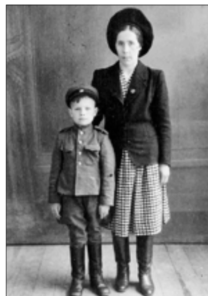
■ Вместе с мамой перед отъездом на Родину. 1946 год