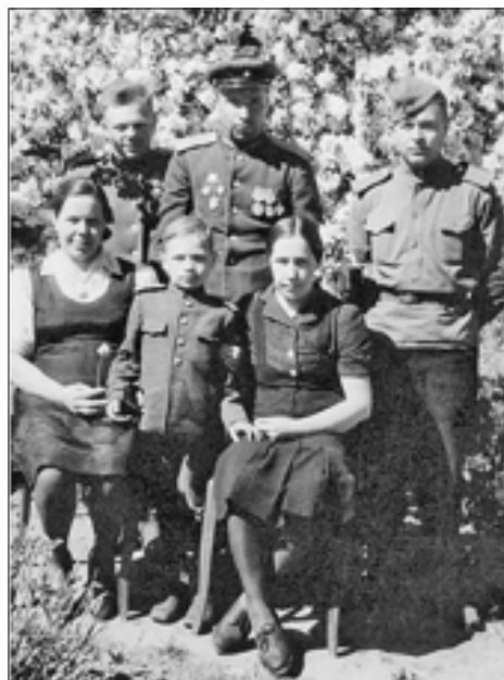
■ День Победы в г. Тессин: на улицах города и в офицерской столовой