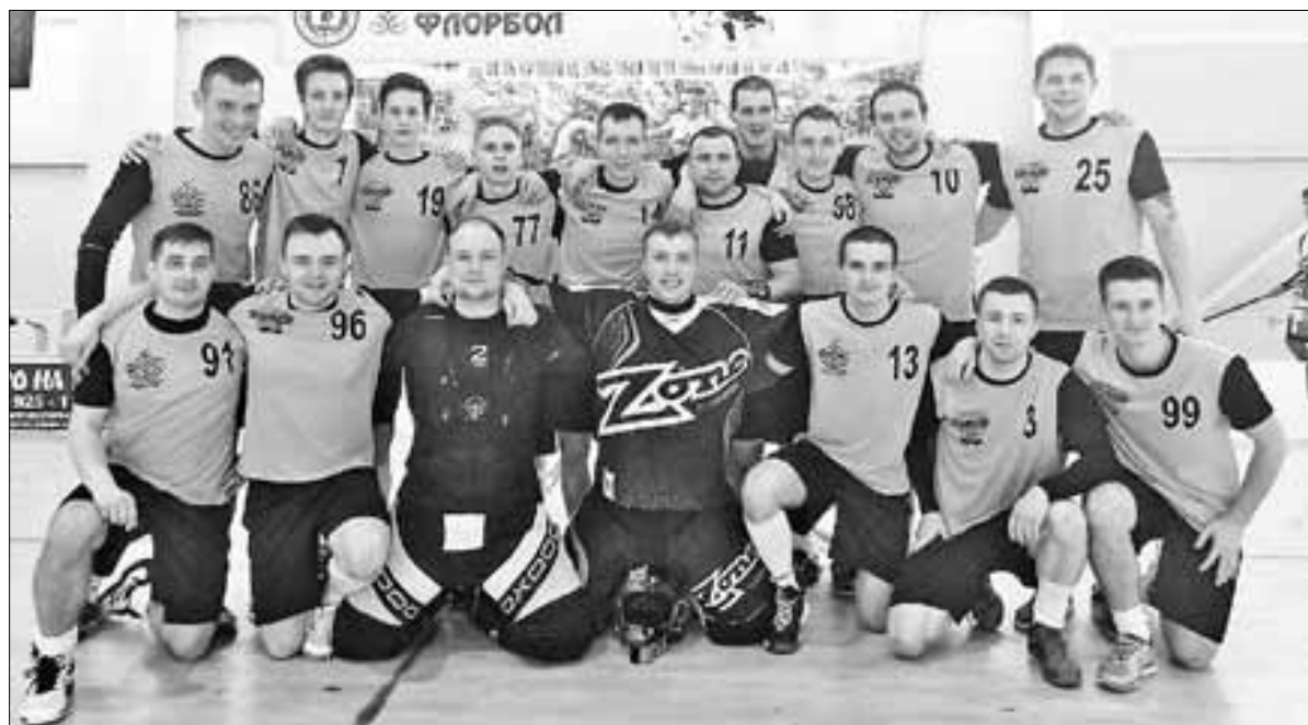
■ «Помор» после успеха в Ульяновске.