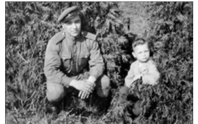
■ На одном из занятий по боевой подготовке. Весна 1946 г.