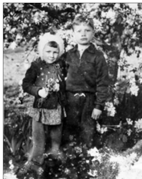
■ Маленький Степа с дочерью командира воинской части. 1946 год, Тессин