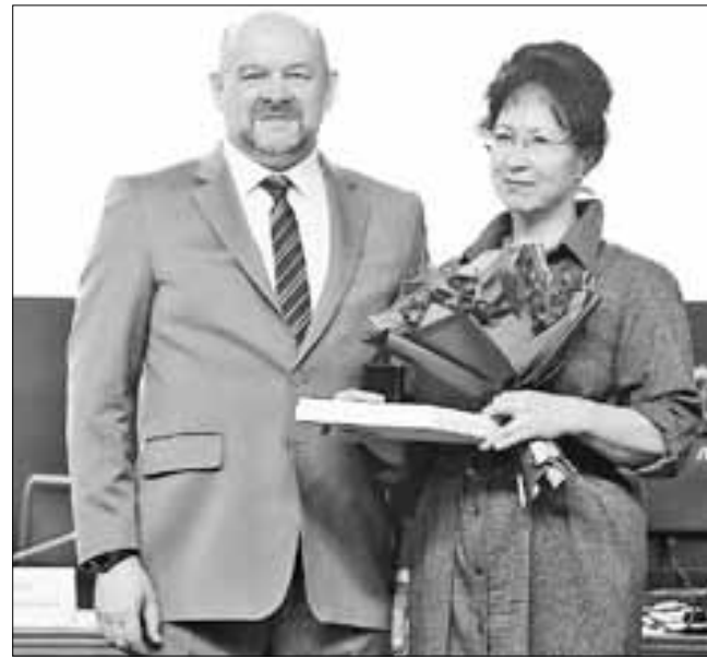
■ В рамках работы коллегии Игорь Орлов вручил медикам области региональные награды.

– В 2020 году сфера здравоохранения выходит на новый виток развития, нас ждут новые вызовы и победы. Уверен, что благодаря нарабатанному опыту вме-