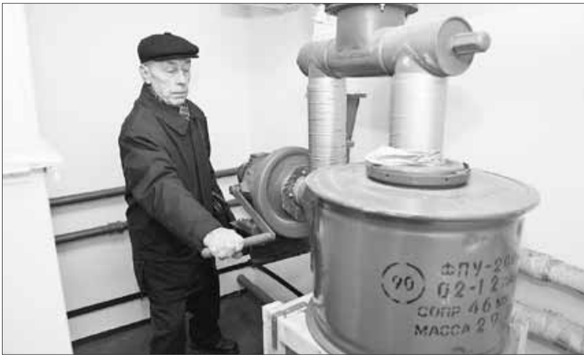
■ Фильтро-вентиляционная установка, обеспечивающая автономную подачу воздуха, может работать в ручном режиме.