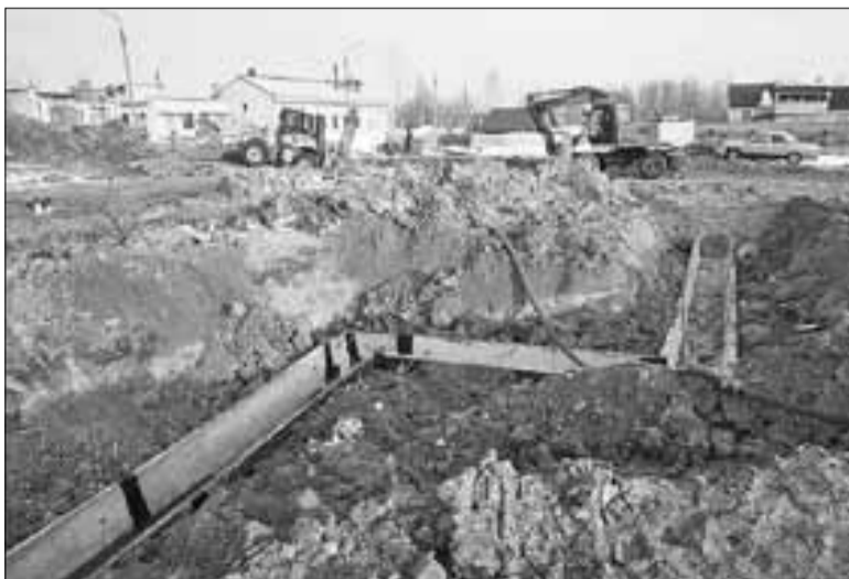
■ Муниципалитет продолжил освоение этих земель, некогда пустующих: идет прокладка сетей.