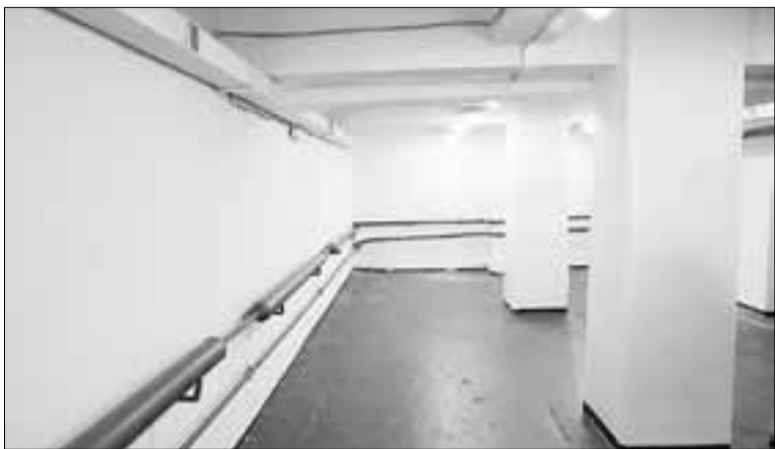
■ Муниципальные укрытия мэрия поддерживает в порядке