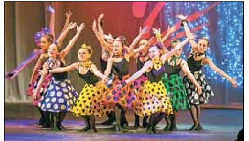
■ Праздничный концерт в АГКЦ, посвященный юбилею «Стремления», был ярким и насыщенным.