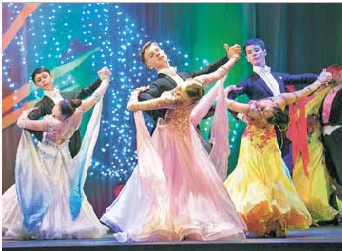
■ Посредством языка танца можно донести до зрителя любые чувства и эмоции.

Прошли годы, и студия спортивного танца «Стремление» преобразовалась в хореографический центр АГКЦ. Сейчас там занимается более 800 участников в возрасте от трех до 54 лет. Кружковцы не раз становились победителями всерос-