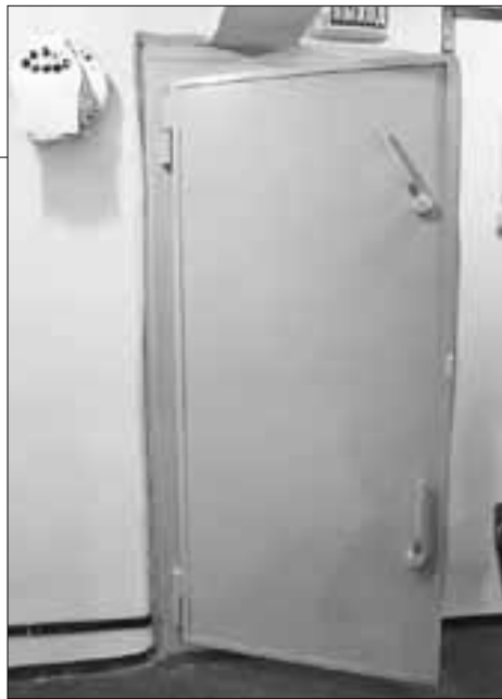
■ Дверь полностью герметична.