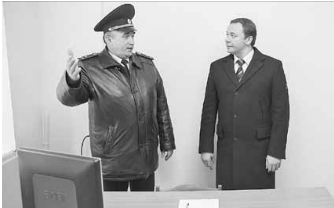
■ Полиция и городские власти заинтересованы в тесном взаимодействии с дружинниками.