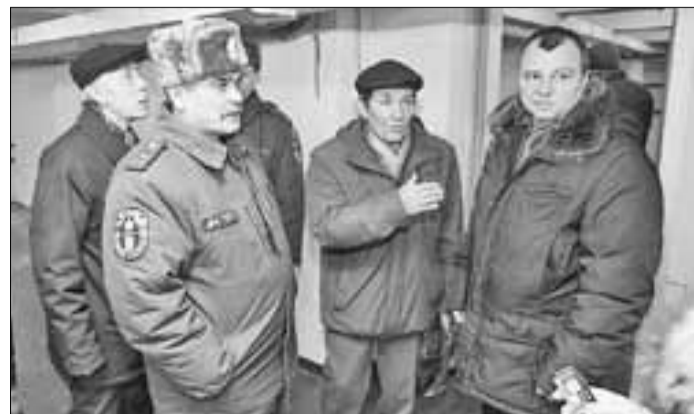
■ Представители МЧС и управления военно-мобилизационной работы и ГО мэрии.