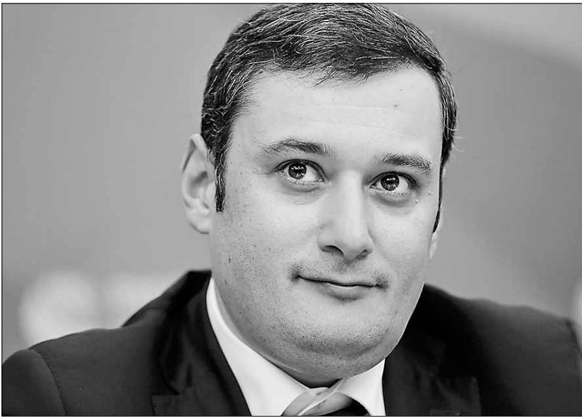
■ Александр Хинштейн: «Сегодняшняя журналистика совершенно точно не хуже журналистики советского времени»

Существующая печатная пресса имеет своего читателя и не собирается уходить на покой. Что позволяет ей удерживать свои позиции на медиарынке, какие у нее перспективы, заменят ли блогеры обычных журналистов и какие рамки закон поставит интернет-изданиям? Об этом рассказал председатель Комитета Государственной Думы по информационной политике, информационным технологиям и связи Александр Хинштейн.