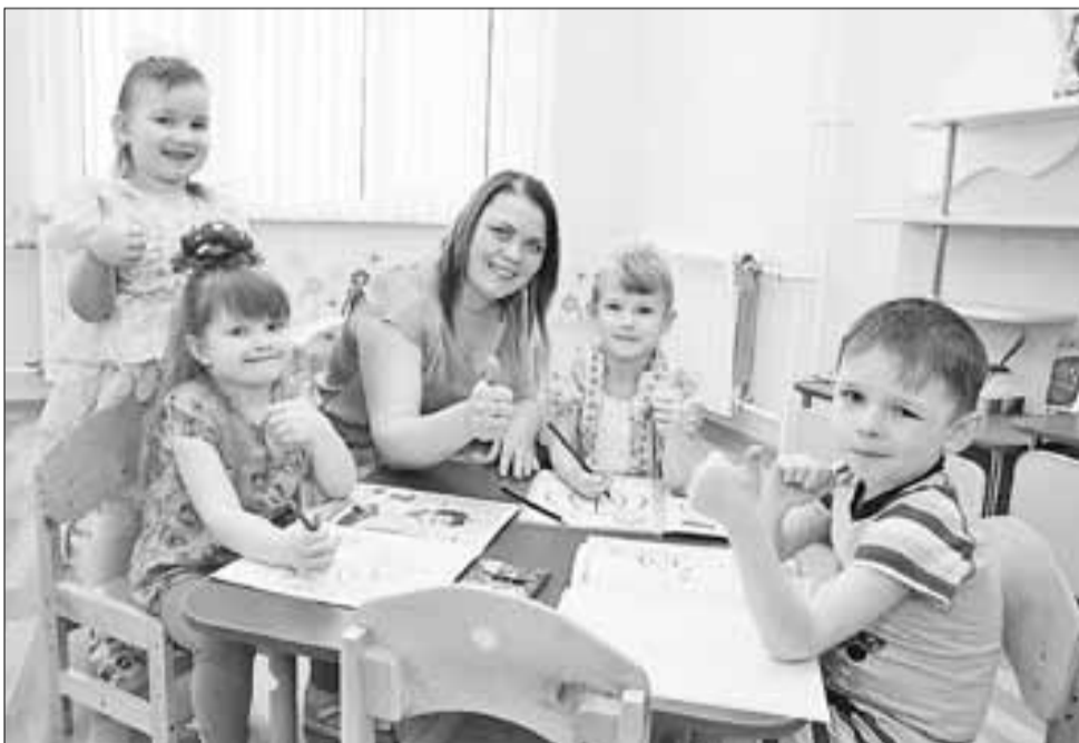
■ В детсадах Архангельска для детей стремятся создать самые лучшие условия

На базе детсада № 10 «Родничок» за круглым столом состоялась интересная дискуссия на тему «Принципы организации развивающей предметно-пространственной среды дошкольных образовательных учреждений в соответствии с федеральным государственным стандартом дошкольного образования».