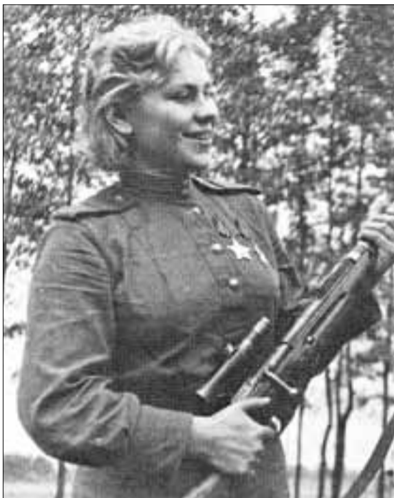
■ Снайпер Роза Шанина – кавалер двух орденов Славы. 1944 год.

В 55-м году ее именем назвали улицу в Архангельске. Возможно, выбор улицы был неслучаен – хотя здание педучилища и находилось в другом месте, здесь уже плани-