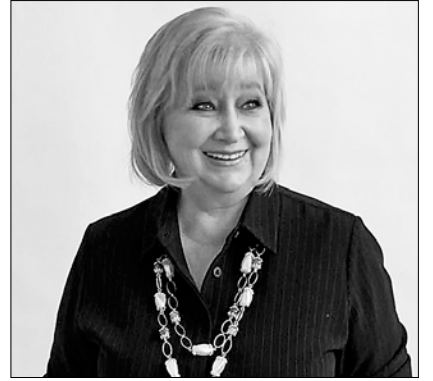
Елена ВТОРЫГИНА, заместитель председателя Комитета Государственной Думы по вопросам семьи, женщин и детей

Желаю всем женщинам Поморья отличного весеннего настроения, приятных сюрпризов от любимых и родных, исполнения самых сокровенных желаний. Будьте счастливы!