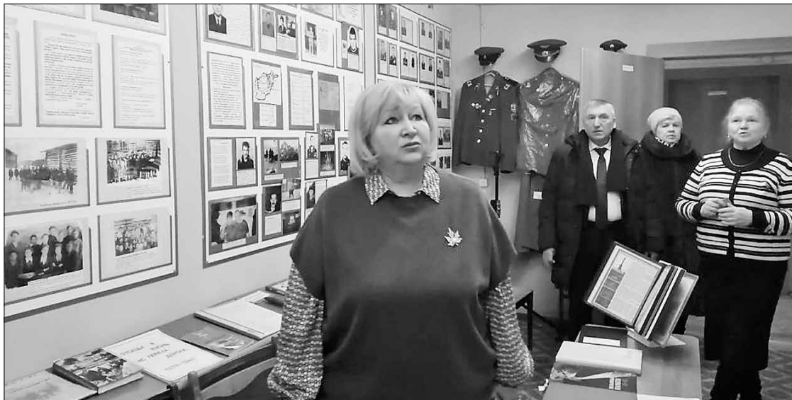
■ В здании Лешуконской школы-интерната располагаются музеи Великой Отечественной войны и пионерии