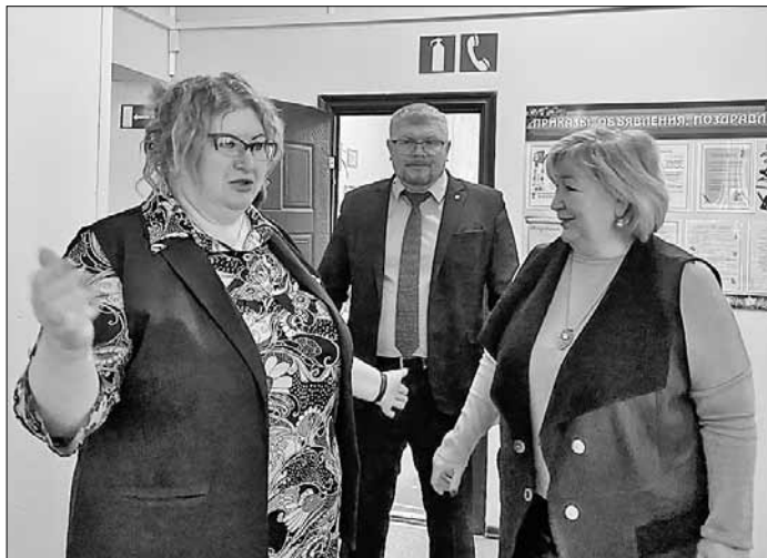
■ Дорогорская школа нуждается в ремонте, а сельские дети достойны получать образование в комфортных и современных условиях

Ребята сами помогают готовить выставки и экспозиции, а это еще больше погружает их в историю и помогает прочувствовать все события тех времен. Гости посетили музей, встретилась с педагогами и детьми.