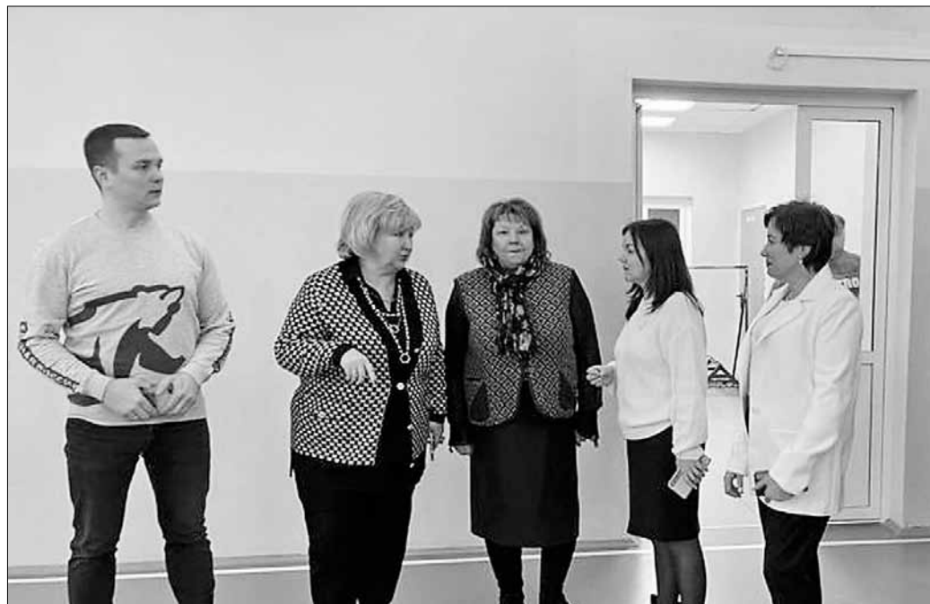
■ В Пинежском районе продолжается ремонт Карпогорской средней школы

– Действие программы «Земский доктор/фельдшер» и целый комплекс мер поддержки медицинских работников помогают привлечь все больше специалистов, в том числе из других регионов. В 2022 году в Архангельскую область