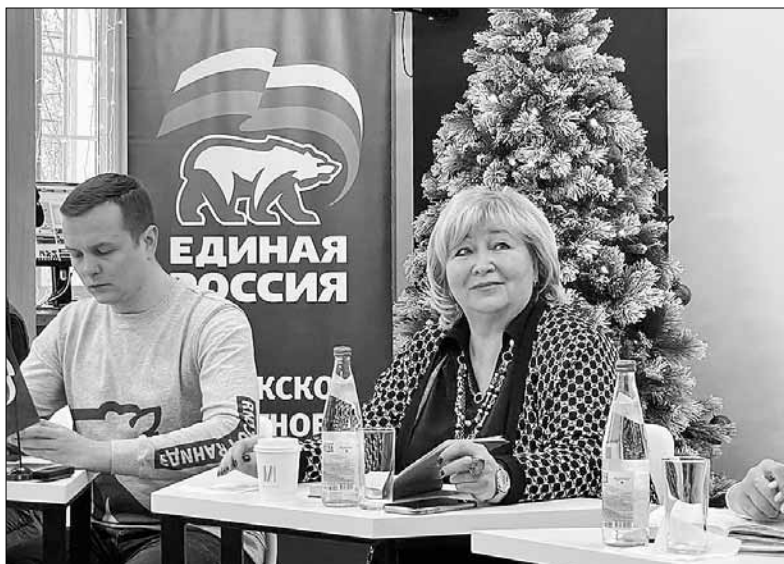
■ Пинежский район – участник национальных проектов, в рамках которых капитально ремонтируются школы и дома культуры, создаются спортивные объекты, центры дополнительного образования, благоустраиваются территории населенных пунктов

Депутаты округа обозначили наиболее проблемные моменты, волнующие земляков. Большая их часть касалась состояния дорог, мостов