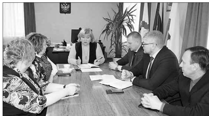
■ Депутаты Мезенского округа обозначили наиболее проблемные моменты, волнующие земляков