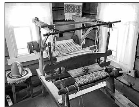
■ 20 лет назад жители деревни Еркино объединились в первый в районе ТОС и развивают свою территорию. Их флагманский проект – это «Марфин дом: Смыслы. Сплоченность. Результат»

дией студентам и ординаторам, обучающимся по целевым направлениям.