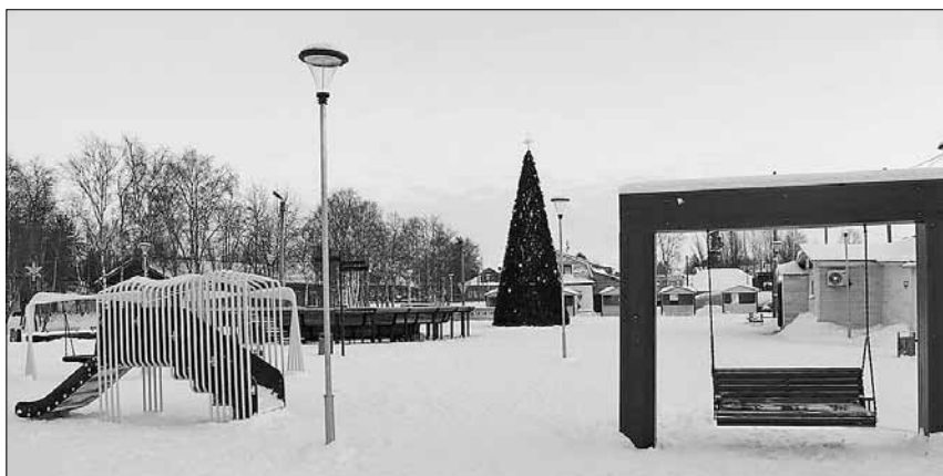
■ В Мезени в 2022 году открыли три благоустроенных территории