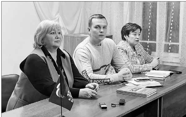
■ Состоялась заинтересованная встреча с жителями Суры, Городецка и Шуйги