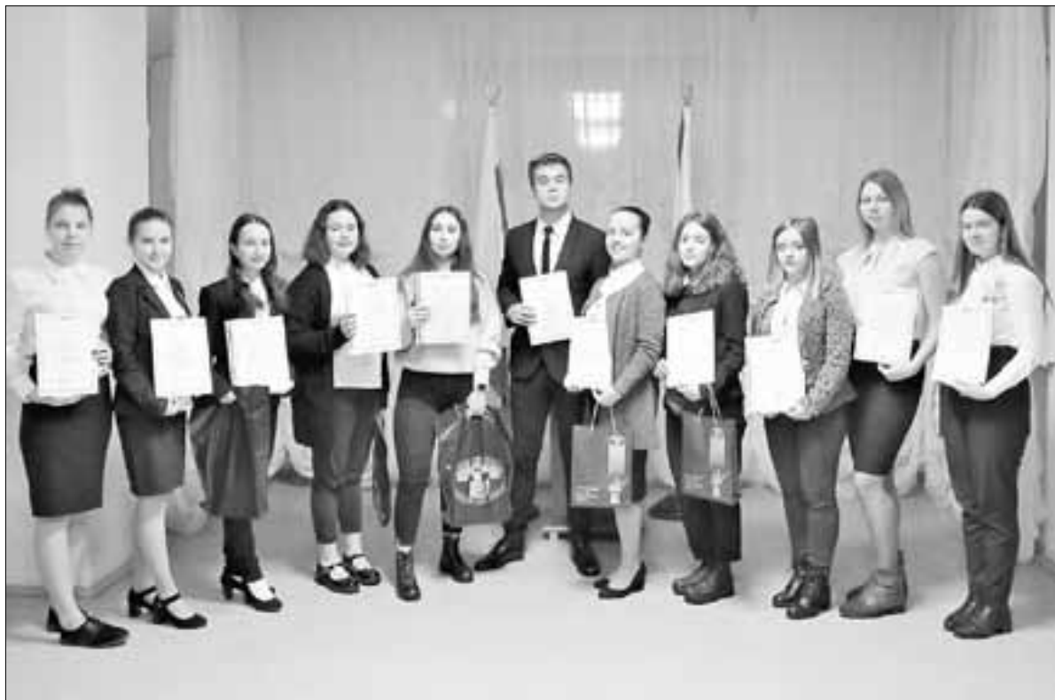
ФОТО ПРЕДСЕДАТЕЛЯ ИЗБИРАТЕЛЬНОЙ КОМИССИИ ГОРОДА АРХАНГЕЛЬСКА

Кроме того, как раз в этот период в Архангельске проходили предметные олимпиады, в том числе по праву и обществознанию, и мы очень благодарны, что и учащиеся, и педагоги, и родители нашли время для нашей олимпиады. Выражаем признательность 14-й школе, которая нам помогла в предоставлении площадки для проведения городского этапа олимпиады.