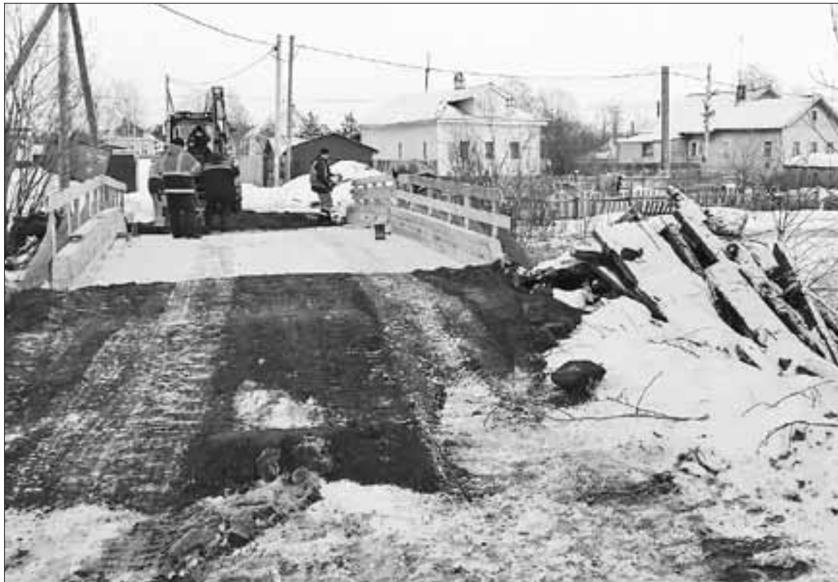
■ Ремонт моста через реку Долгая Щель в Маймаксе.

– Масштабный ремонт железнодорожного моста, из-за которого он закрывается на ночь, имеет к вам отношение?