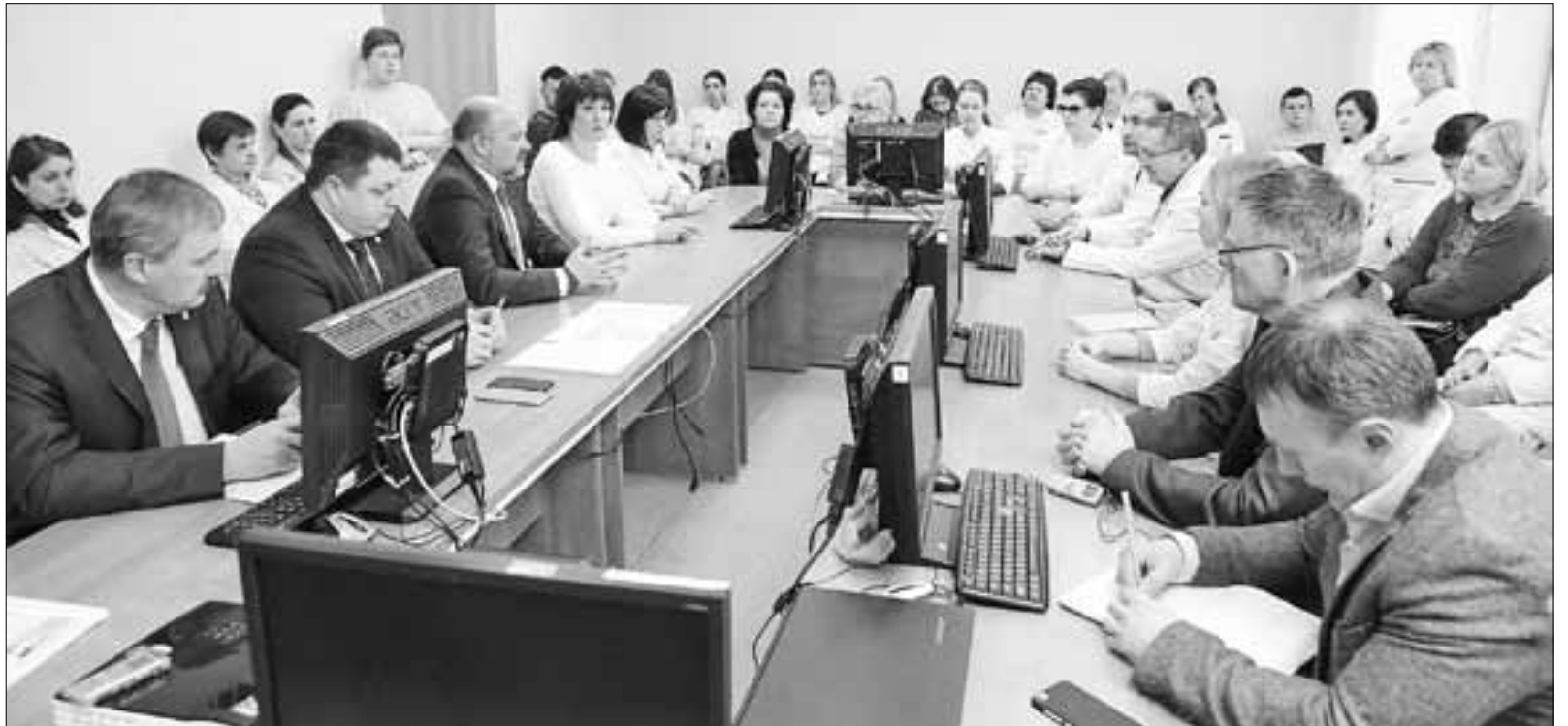
■ Перспективы развития учреждения Игорь Орлов обсудил на встрече с коллективом 7-й горбольницы.

Учреждение участвует в проекте «Создание новой модели медицин-