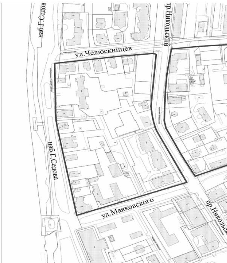
СХЕМА границ проектирования

Приложение к техническому заданию на подготовку проекта планировки территории в Соломбальском территориальном округе г. Архангельска в границах наб. Георгия Седова, ул. Челюскинцев, пр. Никольского, и ул. Маяковского