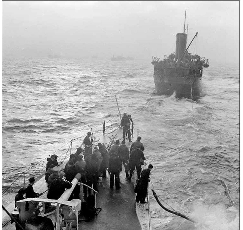
■ Заправка топливом в море британского тральщика

Президент Соединенных Штатов Ф. Д. Рузвельт в беседе с послом СССР в США М. М. Литвиновым высказал мнение о том, что вооруженные силы Соединенных Штатов могли бы взять на себя оборону части фронта в районе Мурманска. Кроме того, Рузвельт отметил, что Советский Союз вполне заслуживал того, чтобы получить неза-