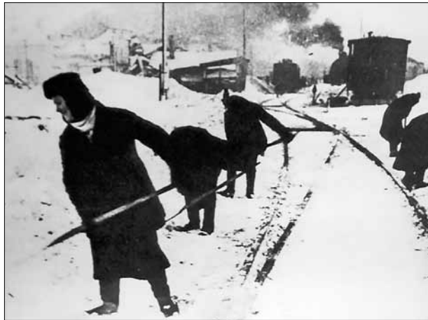
■ Работы по расчистке снежных заносов на железной дороге

ну Норвегии. В итоге было принято окончательное решение о прорыве из Бреста линейных кораблей «Scharnhorst», «Gneisenau» и тяжелого крейсера «Prinz Eugen» через Ла-Манш для последующего базирования на норвежские порты. «Всякий корабль действующий не у берегов Норвегии, воюет не там, где положено», – заявил Гитлер.