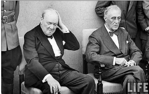
■ У. Черчилль и Ф. Д. Рузвельт

Во время встречи в Вольфшанце с главнокомандующим кригсмарине адмиралом Э. Редером Гитлер заявил, что последние доносения убедили его окончательно: Великобритания и США собираются захватить Северную Норвегию и тем самым внести коренной перелом в ход войны. Он ждет, что в ближайшем будущем союзники попытаются создать многочисленные плацдармы на побережье от Тронхейма до Киркенеса, а весной начать полномасштабное наступление с участием русских. У него есть убедительное доказательство того, что Швеция обещаны Нарвик и никелевые рудники Печенги, а потому она выступит на стороне западных стран. Гитлер назвал Норвегию «зоной судьбы, где решается исход войны». Он подчеркнул, что сильная оперативная группа из линкоров и крейсеров, практически весь германский флот, размещенная вдоль норвежского побережья, совместно с люфтваффе внесет решающий вклад в оборо-